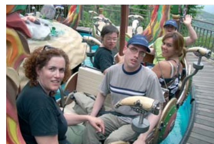
Sortida al Tibidabo

El dia 7 de juny un grup de 9 usuaris acompanyats de les respectives ATE van participar de la jornada de portes obertes del TIBIDABO de Barcelona. Van sortir d'aquí cap a les 10 hores del matí i van arribar a les 17 hores