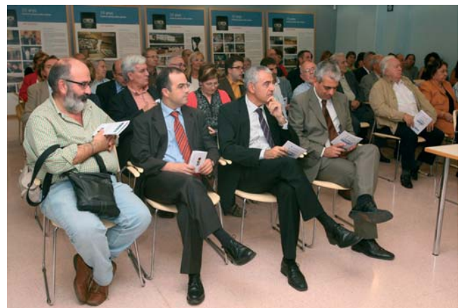
Assistents a la presentació del programa d'actes

Però també s'ha obert la celebració del 15è Aniversari de la FVO a la resta de professionals del sector a través de la convocatòria del Concurs de projectes