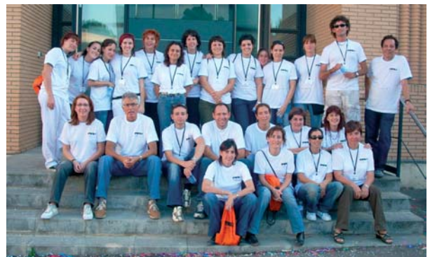
Gup de professionals voluntaris de la FVO

Més de 25 professionals de la Fundació Privada Vallès Oriental van preparar tot el necessari per aconseguir que les persones amb discapacitat i les seves famílies passessin una gran jornada de germanor. A més, van ser els primers en engrescar-se a ballar i a animar la festa. A tots ells i elles moltes gràcies!