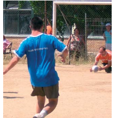
Activitat d'esport d'estiu

- Hem celebrat la festa d'estiu amb tots els companys del Centre Ocupacional, amb ball, música, pisco-labis i aigua. 30 juliol.