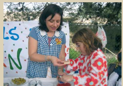
Fent proves, un dels actes més divertits.

- El dia 20 de juny es va celebrar a l'escola la festa del final de curs.