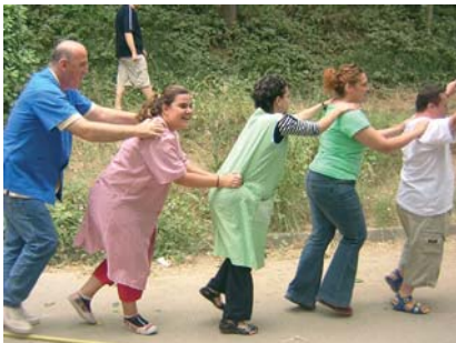
Festa d'estiu del Centre Ocupacional