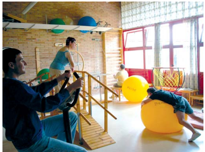
Activitat de psicomotricitat

En aquests moments existeixen un munt d'interrogants al voltant del futur dels centres d'atenció diürna que fa que els professionals del sector a través de les federacions s'hagin posat a treballar per