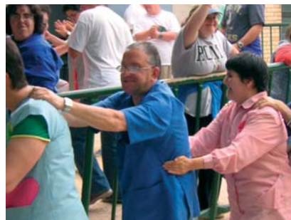
Ballant a la festa d'estiu