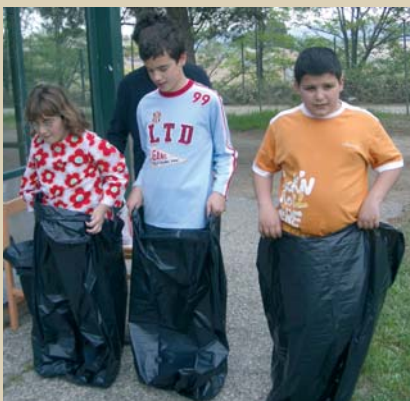
Les curses de sacs, una prova ineludible.

- Els dies 4, 5 i 6 de juny es van fer les convivències a Comarruga per quatre aules de secundària i quatre de primària.