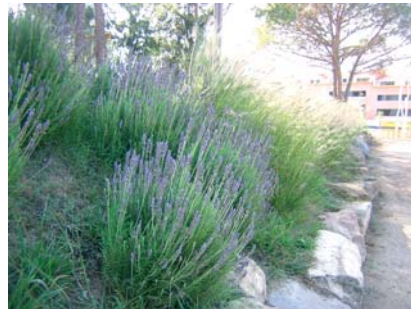
Arbustives del bosc de les escoles de Vilanova del Vallès

Si les plantem en un sòl ben preparat, i ho fem al llarg de la tardor, a l'hivern faran una bona crescuda. En el cas dels pensaments, arribarem a veure'ls penjar per sobre les jardineres, i en el cas dels ciclàmens, els podrem gaudir en un gran pom de flors.