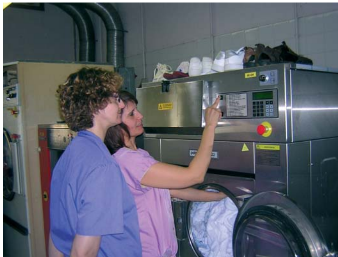
Serveis d'Ajustament Personal i Social (SCAPS)

Així doncs, sempre és ben vinguda qualsevol iniciativa adreçada a dinamitzar i promoure una tasca tan complexa.