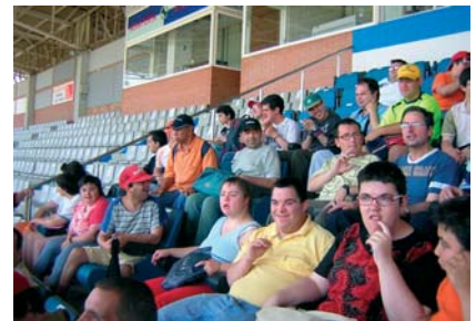
Visita al poliesportiu de la Creu Alta de Sabadell