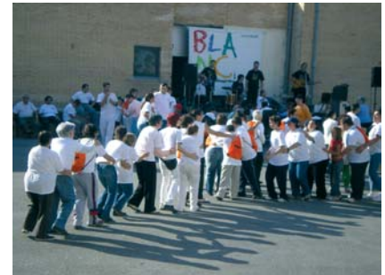
Per finalitzar la festa, El Tramvia blanc