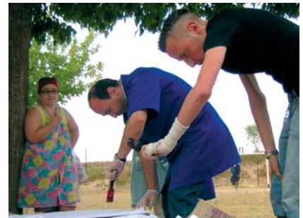
Activitat de pintures de samarretes dels grups del SOI