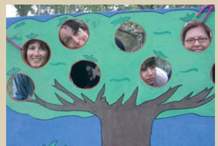
A les festes tots ens ho passem bé.