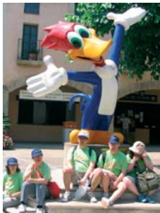
Sortida a Port Aventura

Fa molt de temps que teníem pensat fer una sortida a aquest parc d'atraccions. Finalment l'hem poguda fer realitat aquest any. El dimarts 12 de juny un grupet de 5 usuaris es van desplaçar fins a Salou en una furgoneta de la Fundació per poder gaudir de les instal·lacions de Port Aventura. Van sortir cap a les 9 del matí ja que el trajecte és força llarg i per poder aprofitar el dia van arribar cap al vespre a la residència. Allà van poder gaudir de molts dels espectacles que s'ofereixen així com pujar a les atraccions que van trobar adients per a ells. Tots van arribar esgotats de tantes experiències noves però a la vegada molt contents.