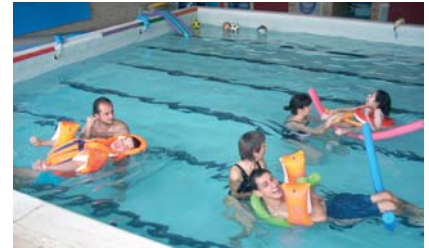
Activitat de piscina

Amb la arribada del bon temps el nombre de sortides augmenta considerablement. Diàriament s'han fet sortides a les piscines