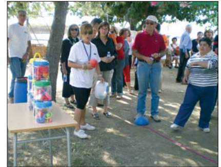
Jocs de punteria