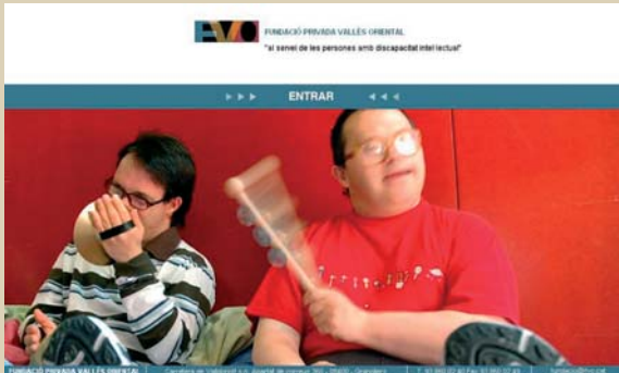
Imatge de la nova web de la FVO

La Fundació Privada Vallès Oriental va mostrar la seva nova pàgina web corporativa, en el marc de la presentació del programa d'actes commemoratius del 15è Aniversari de la FVO celebrat el darrer dimarts 25 de setembre. La nova web, recull tota la informació sobre la Fundació, com s'organitza i els seus diversos serveis. Però el més important és que a través de la secció de notícies d'interès i agenda vol donar a conèixer encara més les activitats i informació interessant que l'entitat genera. Properament, la web inclourà un espai interactiu (actualment en construcció) que té com a objectiu recollir aquelles propostes i iniciatives que els amics de la FVO ens vulguin fer arribar.