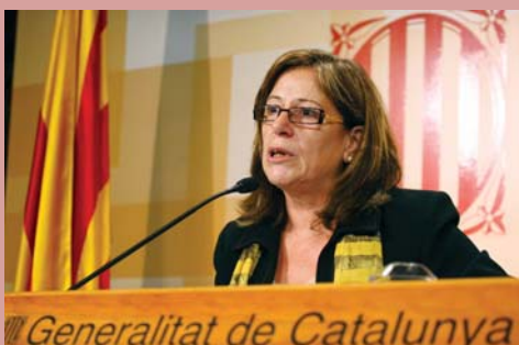
La Consellera Capdevila en el moment d'annunciar el Pla de Suport al Tercer Sector Social

Per la consellera d'Acció Social i Ciutadania, "aquest Pla repercutirà en la capacitat inversora de les entitats del tercer sector social per poder competir davant les noves demandes d'equipaments i de serveis que des de l'administració pública els requerirem".