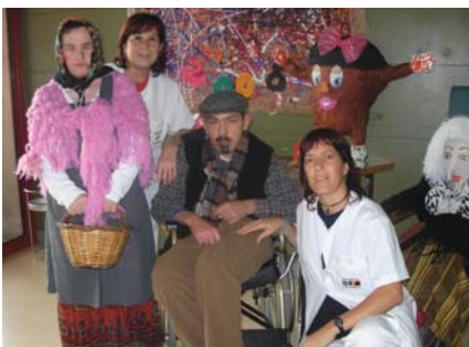
Els castanyers 2008