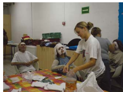
Tots treballem els motlles