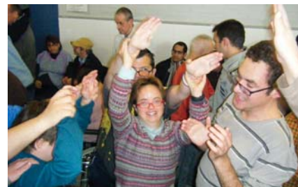
Som una bona colla celebrant la Castanyada

El dijous 30 d'octubre vam celebrar al Taller la Castanyada. Vam començar ja de bon matí coent les castanyes i els moniatos i elaborant les paperines per posar-hi el menjar un cop cuit i així mantenir-lo ben calent. Cap a mitja tarda vam baixar tots al menjador, on hi havia l'equip de música ja preparat i una gran taula plena de paperines amb moniatos i castanyes i un munt de gots amb refrescos. Entre música, companys i monitors vam ballar, xerrar i cantar. Érem una bona colla! El més difícil va ser menjar-se la gran quantitat de castanyes i moniatos que van portar els usuaris. No va haver-hi forces ni estómacs capaços de menjar-s'ho tot!