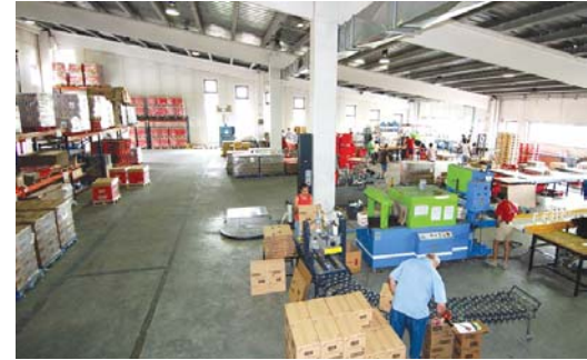
L'FVO ha fet una aposta per la professionalització del CET.

La qualitat és un tret que ens diferencia de la nostra competència. Però les exigències en aquest sentit creixen dia a dia, fins al punt que garantir la qualitat tant del procés com del producte acabat, ha de ser un aspecte plenament integrat dins de