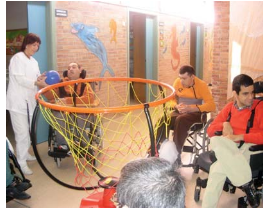
Participant en les activitats esportives

Aquest any, el partit de futbol es va celebrar el dia següent, dijous 27 de novembre . Van participar en aquesta lligueta els equips de futbol dels tallers i la Residència, que van competir amb moltes ganes junt amb l'equipet de professionals. Els felicitem a tots perquè ho van fer més que bé.