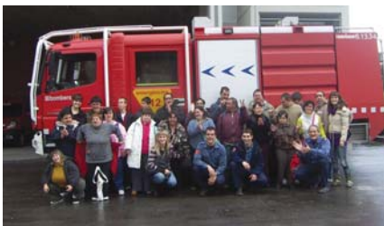
Els bombers ens van explicar què fer en cas de perill

El 31 d'octubre vam anar a visitar l'Escola de Policia de Catalunya on es formen els mossos d'esquadra, la policia local i els bombers. La visita va durar una mica més de dues hores, en les quals ens van