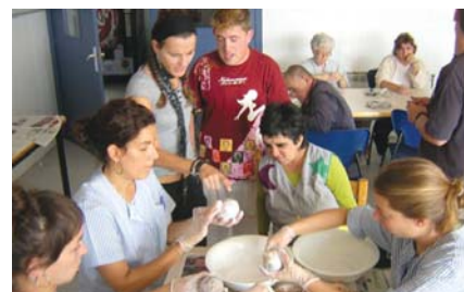
Tindrem un arbre de Nadal ben guarmit

Tres grups del Centre Ocupacional "Xavier Quincoces" han fet boles amb motius nadalencs per penjar a l'arbre de Nadal. L'objectiu d'aquesta activitat, a banda de treballar i aprendre la tècnica del paper maxé, és poder baixar a Granollers i mostrar la feina feta a la gent del carrer.