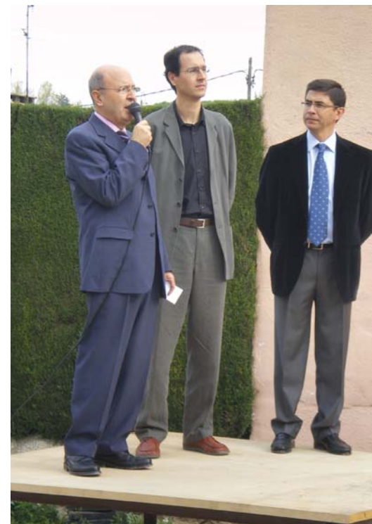
En l'acte de col·locació de la primera pedra es va reconèixer el compromís de la família Anfruns, l'FVO i el poble de Santa Eulàlia vers les persones amb discapacitat intel·lectual

potencialitat per arribar a ésser el que podem ser" . Des de l'Ajuntament, s'ha intentat contribuir a aquesta nova llar-residència "de la manera més diligent possible" ja que "l'Ajuntament és al servei de les persones" .