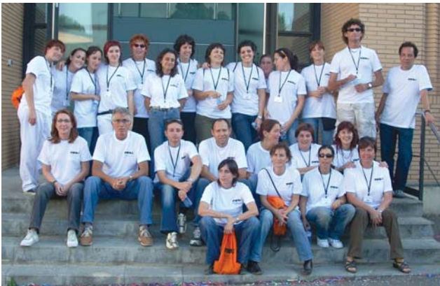
L'equip de voluntaris que va participar a la Festa de Famílies del 15è aniversari, professionals compromesos amb el projecte social de l'FVO

Un dels aspectes més ben valorats en el qüestionari de satisfacció del client intern 2008 estava directament relacionat amb la valoració que es feia d'apartats que tenien a veure amb les persones, per sobre de punts com la comunicació, organització o gestió. És evident que a l'FVO el factor humà pren una gran importància. Tenim persones que tenen cura d'altres persones. Professionals que treballen amb persones especialment sensibles que requereixen una atenció especialitzada, on el compromís i la dedicació de cada professional és fonamental per millorar la qualitat de vida de les persones que s'atenen.