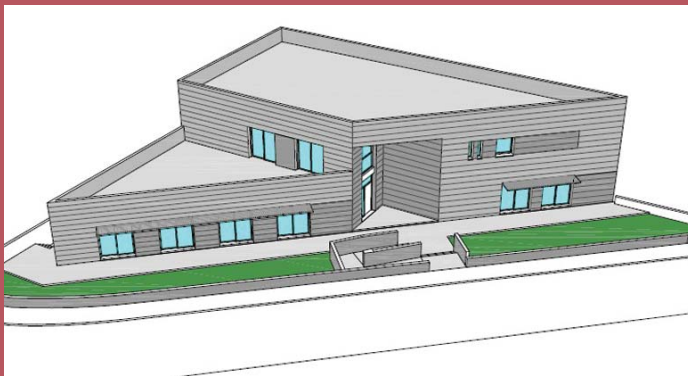
Disseny de la façana principal de la nova llar-residència de l'FVO

La llar tindrà 653 m 2 entre les dues plantes construïdes a més de 327 m 2 de soterrani. Per a la Fundació es tracta d'un projecte important, ja que l'entitat encara no tenia implantat cap servei destinat a les persones amb discapacitat intel·lectual fora de la ciutat de Granollers, apropant els serveis al territori de la comarca del Vallès Oriental. Amb aquest nou projecte, l'FVO aconsegueix amb l'objectiu d'ampliació de serveis i recursos propis en l'àmbit de l'acolliment residencial, objectiu establert al Pla Estratègic 2007-2011 de la Fundació.