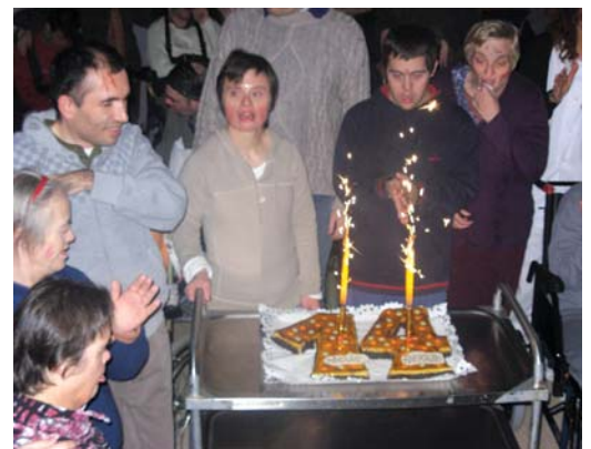
Ja ens anem a menjar el pastís del 14è aniversari