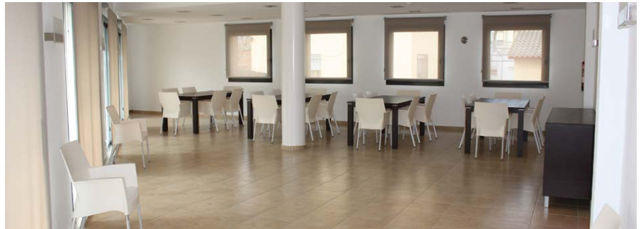
El menjador preparat per a rebre als futurs usuaris i usuàries