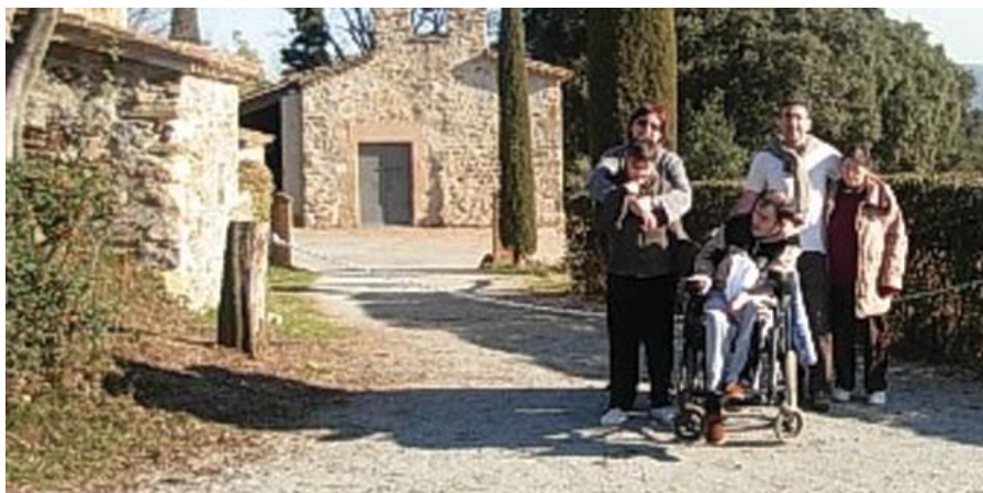
Passejant pels voltants