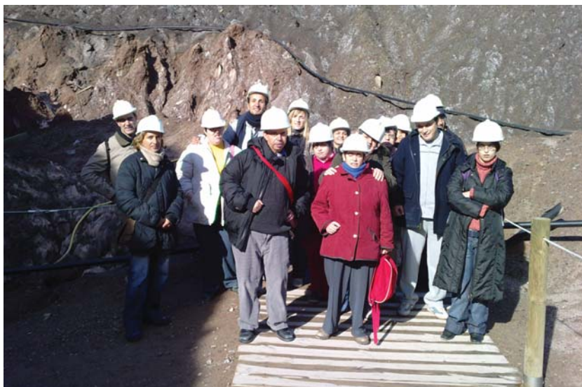
Tots atents a les explicacions sobre la Mina de Sal