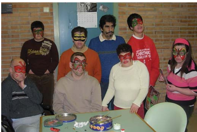
Dimarts tots amb la cara pintada