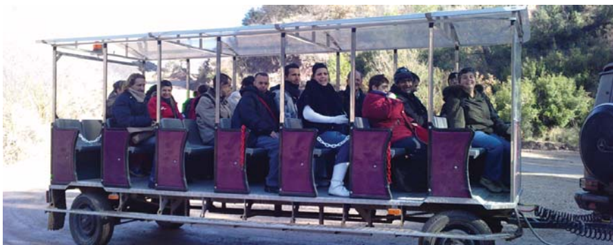
Preparats per iniciar el trajecte en tren

Vam pujar en un tren que ens va portar fins l'entrada de les mines, allà vàrem poder veure i tocar la sal en el seu estat original i ens van fer una explicació de com es treballava a les mines. Els nostres usuaris i usuàries van gaudir molt amb la sortida.