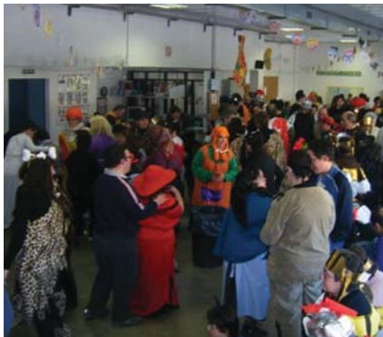
Un moment de la divertida festa de Carnestoltes

Ho vam passar molt bé i els nostres usuaris com sempre van gaudir d'una festa més per a recordar fins l'any que ve, compartint amb els companys i l'equip d'educadors del servei.