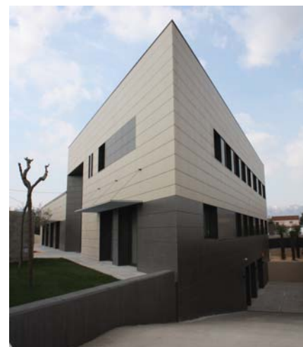
Detall de la característica forma triangular d’aquest nou servei de l’FVO