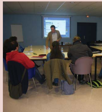
La formació d'alguns dels nous professionals per a la nova Llar-residència

Entre els dies 8 i 19 de febrer s'ha impartit el Kurs de Formació per a cuidadors i cuidadores de la nova Llar-residència "Jaume Anfruns i Janer". Les sessions formatives han estat impartides per professionals de l'FVO, als quals agraïm el compromís i dedicació en la preparació del programa formatiu. Les diferents sessions han abastat un ampli ventall d'aspectes relacionats amb el món de la discapacitat intel·lectual (psicològics, educatius, assistencials, ètics, normatius, etc.) per tal de garantir una atenció de qualitat als futurs usuaris de la nova Llar-residència. L'aprofitament del kurs per part dels participants serà la clau per a configurar la plantilla de la nova llar, situada a Sta. Eulàlia de Ronçana.