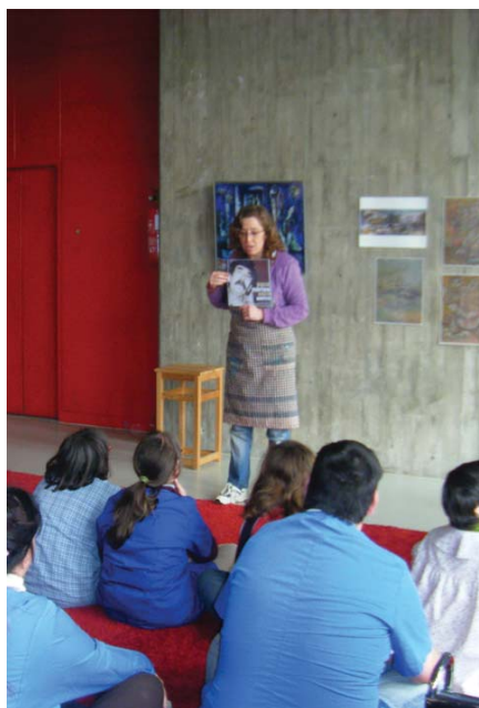
Molt atents a les explicacions