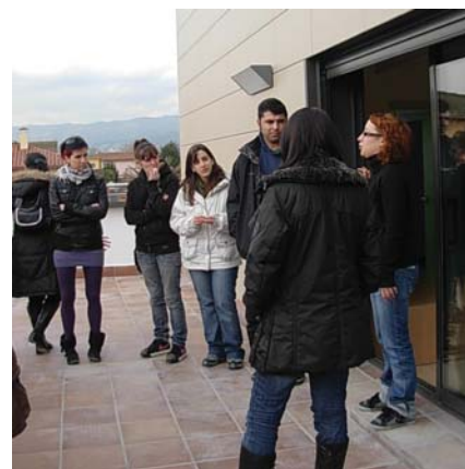
Els cuidadors i cuidadores del Servei d'Habitatge escolten les explicacions de la coordinadora

Cal destacar, les dimensions dels lavabos i dels espais en comú, del jardí i terrassa i el fet que hi hagin 6 habitacions individuals. Els cuidadors i cuidadores van donar idees, per l'equipament de la sala polivalent.