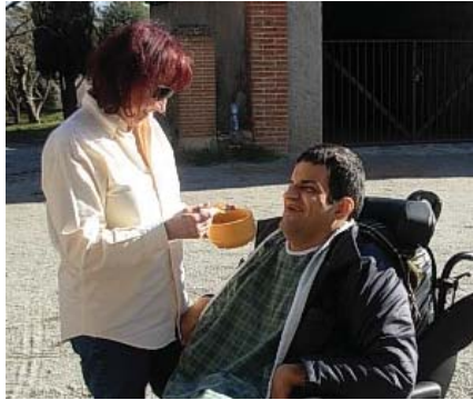
Dinant a l'exterior

El passat divendres 22 de gener, un grupet de la Residència i Centre de Dia "Valldoríolf" van anar a passar el matí al Santuari de Sant Hilari de Cardedeu. El temps els va acompanyar i van poder fer un pícnic a l'exterior. A la tarda van anar fins a un centre comercial on van poder prendre un refresc i gaudir de l'ambient de les instal·lacions. Van passar un dia molt agradable i s'ho van passar d'allò més bé.