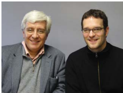
Francesc Sala Tarrés i Oriol Martínez Clavell Arquitectes

I acabem amb el mateix desig que manifestàvem el primer dia, que aquesta casa que ja hem acabat sigui útil a la societat en general i a l'FVO en la consecució dels seus objectius de servei a les persones amb discapacitat.