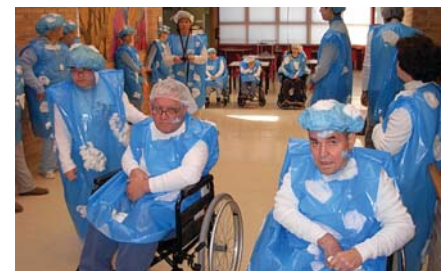
El grup dels núvols