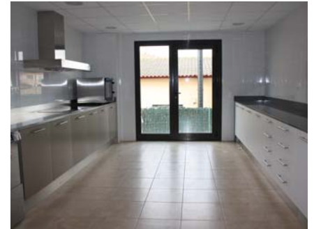
Una imatge de la cuina des de la qual es prepararan els àpats per als 22 usuaris

Ronçana es troba en una zona que permet garantir i potenciar una integració a la vida social i a les activitats del barri, segons les necessitats i possibilitats dels usuaris.