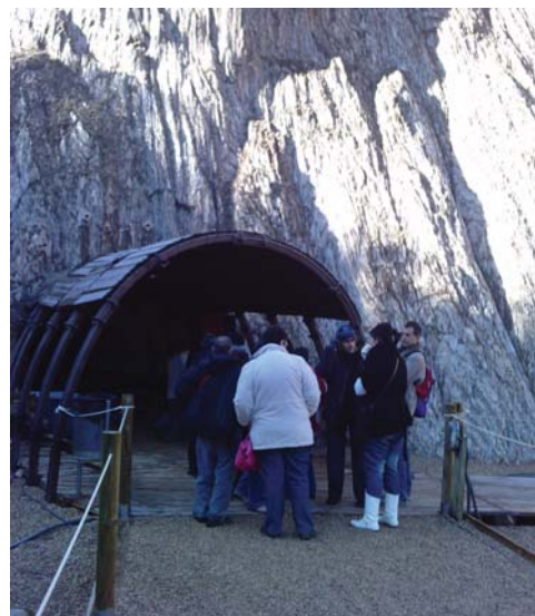
Entrant a la Mina de sal