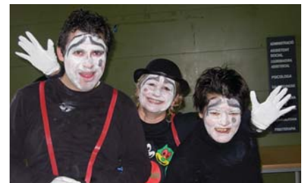
Petita representació dels mims

Per acabar, a la tarda es va fer el ball de mascarots amb música moderna i actual, després per recuperar forces van berenar pastes de xocolata i van beure refrescs. S'ho van passar molt bé!