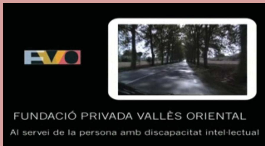
Capçalera del nou vídeo de l'FVO