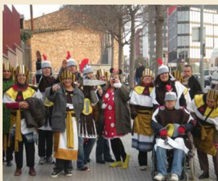
Els egipcis i romans del Servei d'Habitatge de l'FVO

Durant aquests dies de Carnestoltes al Servei d'Habitatge hem estat preparant les disfresses i el diumenge 14 de febrer hem anat a la rua que se celebra a Granollers. Tot i que ha fet molt fred, ha valgut la pena per veure les diferents disfresses: algunes molt originals i les comparses que animaven amb confetti i música. Nosaltres anàvem de romans i egipcis. Hem passat l'estona ballant, cantant i desfilant.