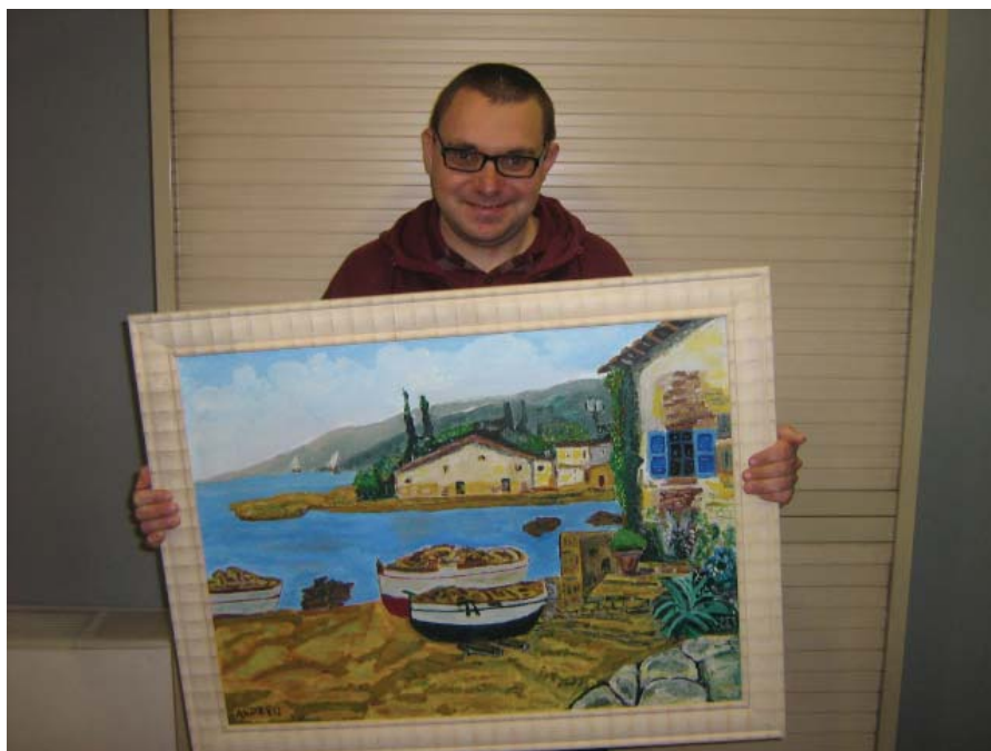
L'Andreu mostra orgullós una de les seves obres

Monitora del Centre Especial de Treball "Xavier Quincoces"