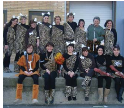
L'original disfressa de l'equip d'educadors del Centre Ocupacional