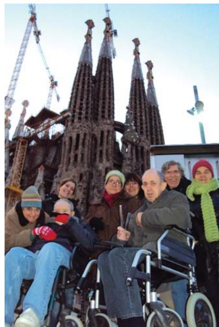
Ben abrigats per visitar la Sagrada Família

Hem passejat i gaudit d'un ambient ple de turistes, després hem acabat la tarda prenent una beguda calenta, mentre observàvem, des de la finestra, la fantàstica obra encara sense acabar.