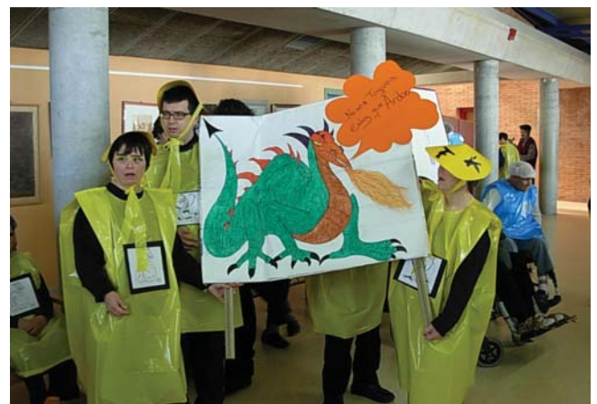
El grup dels xinesos