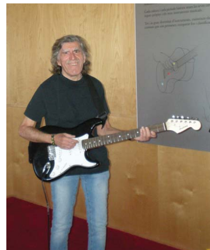
En una excursió al Museu de la Música