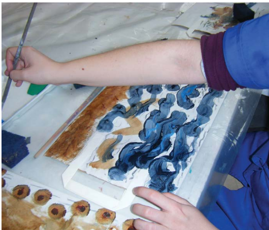
Un exemple de fons de mar