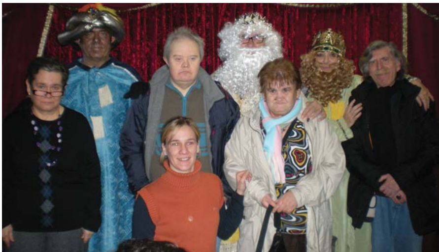
A punt per recollir els nostres regals

Ja estàvem nerviosos de bon matí, i teníem moltes ganes de saber que ens portaven el reis. Ha estat com sempre, un dia emocionant.