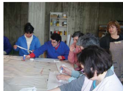
Deixant volar la imaginació