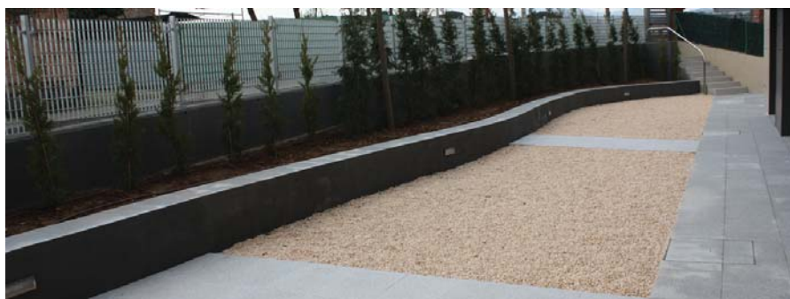
Detall de la zona d’esbarjo

Per la Fundació es tracte d’un projecte important ja que l’entitat encara no tenia implantat cap servei destinat a les persones amb discapacitat intel·lectual a comarca del Vallès Oriental.