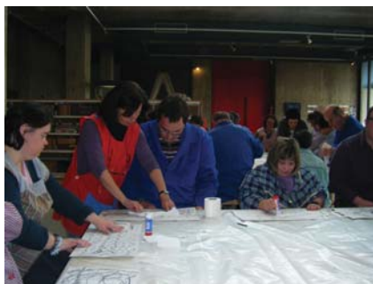
Cadascú va preparar el seu particular fons del mar