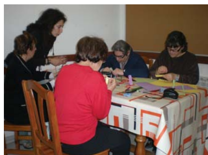
Preparant els obsequis per Sant Jordi