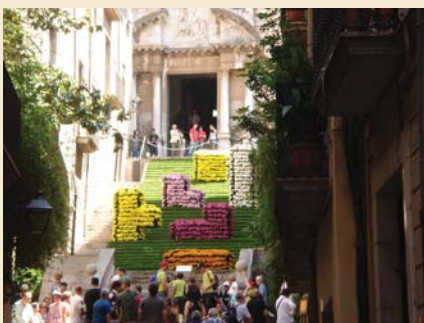
Vam gaudir de les decoracions florals