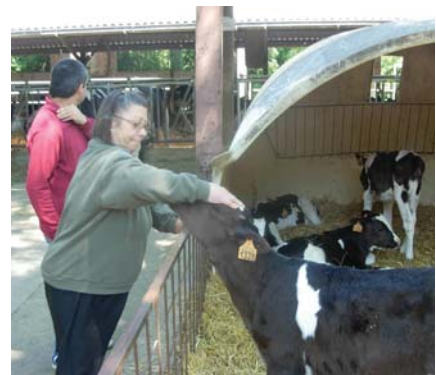
La Mercè tocant el vedell