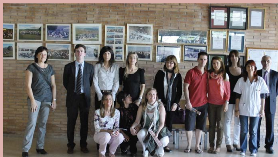
El primer grup de "la Caixa" en visitar l'FVO