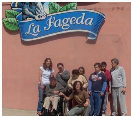
La foto de grup, a La Fageda

Van fer una breu explicació del funcionament de la granja i la visita va continuar cap a la fàbrica, on vam veure l'envasat de la llet amb iogurts i postres. En acabat van poder veure un audiovisual sobre la Fageda i tastar els seus productes.