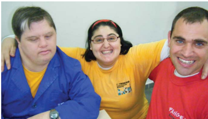
De visita al Centre Ocupacional "El Trencadís"