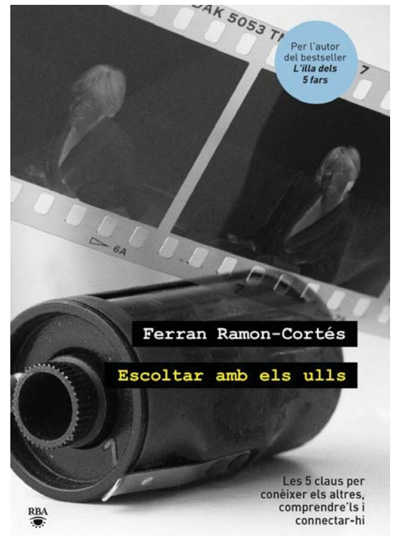
Portada del llibre "Escoltar amb els ulls" de Ferran Ramon-Cortés

psiquiatra suïss, "mai ningú no podrà créixer ni desenvolupar-se en plenitud sense sentir-se estimat almenys per una persona".