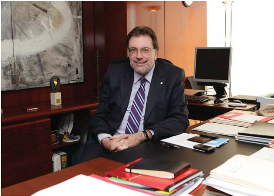
Un moment de la conversa amb el Conseller Cleries