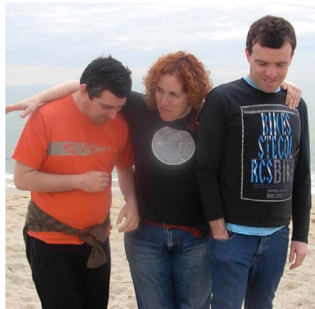
Passeig per la platja