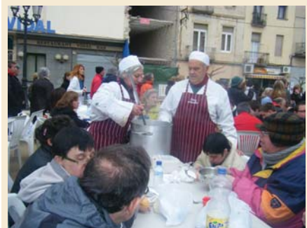
Ja tenim ganes de tornar-hi

Finalment ens vam acomiadar fent-nos prometre que hi tornàrem a l'any vinent. Moltes gràcies pel tracte. No hi faltarem!.