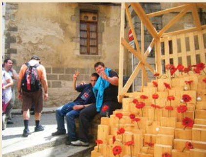
Vam gaudir d'un gran dia