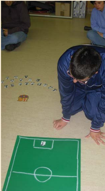
Fent l'alineació del partit

Alguns usuaris els hi agrada el futbol i no es val voler perdre el partit entre el Barça-Madrid. Unes hores abans, van preparar l'alineació dels jugadors en una plantilla del camp i després al vespre van poder veure el partit. xperiència i van venir cansats però contents!