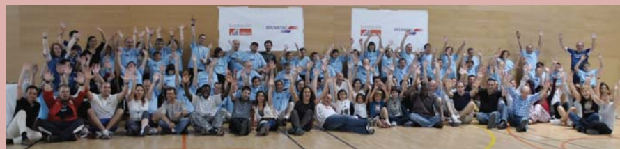
Foto de família demostrant que bÉ ens ho havíem passat

Un grup d'unes seixanta persones ateses a diferents centres i serveis de l'FVO han participat el dissabte 21 de maig en la jornada d'integració social a través de l'esport