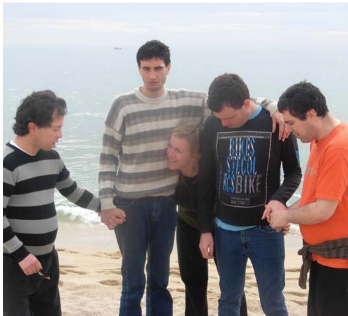
Sortida a la platja de Mataró