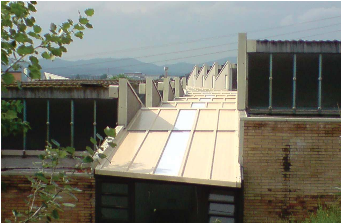
El sostre del Centre Ocupacional un cop finalitzada la nova actuació de reforma

va iniciar durant el període de vacances de Setmana Santa, aprofitant el període d'inactivitat del centre per tal d'interferir el mínim possible amb les activitats del centre i a la vegada intentar que les molèsties derivades de qualsevol obra afectessin en la menor mesura a les persones ateses i als professionals.