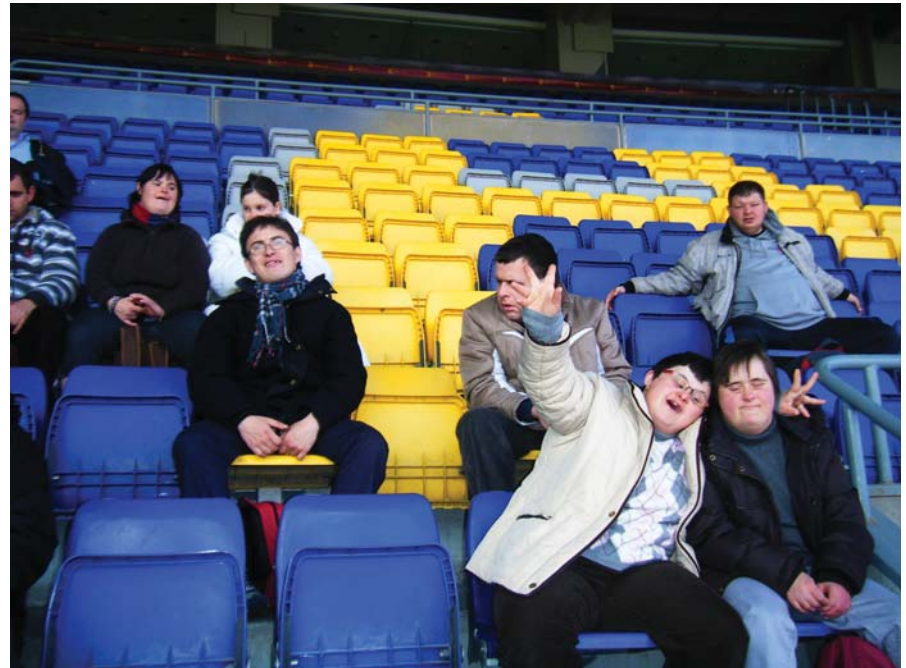
Impressionats a les grades del Camp Nou