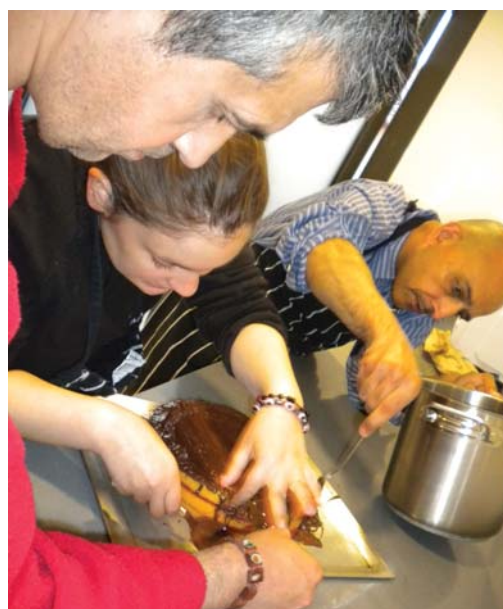
Elaborant la mona