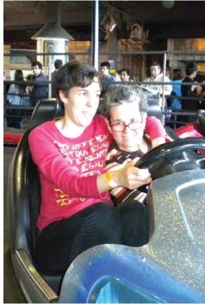
A les atraccions