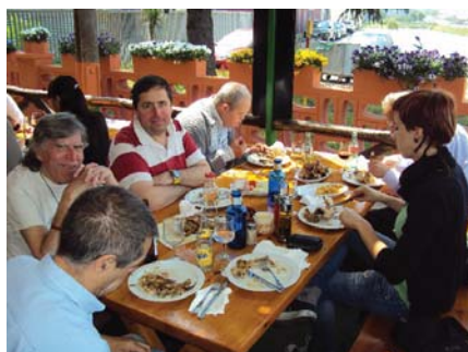
Hora de dinar