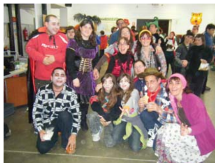
Disfresses molt variades per aquest any

El divendres 4 de març vam celebrar la tradicional festa de carnestoltes del CO, on els educadors i els usuaris van poder gaudir d'una original festa de disfresses, amb música, ball i un berenar amb unes delicioses coques tradicionals de pasta de full i que, aquest any, vam decidir elaborar nosaltres mateixos aquí al centre. Va ser una festa divertida i ho vam gaudir molt.