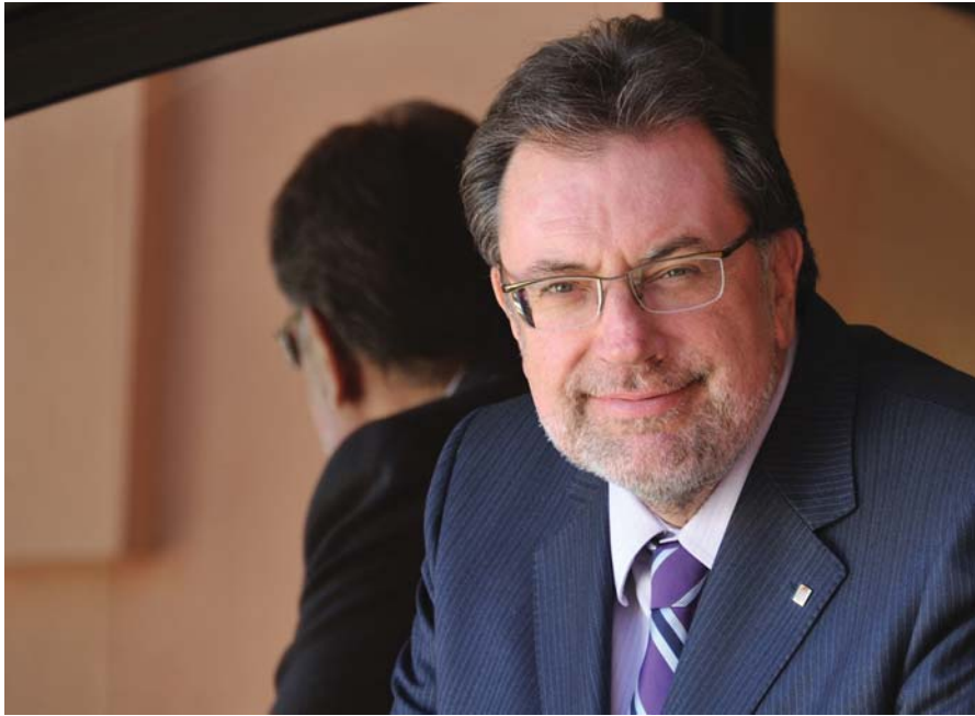
Conseller Cleries: "Totes les persones tenim dret a desenvolupar al màxim les nostres capacitats"

competències exclusives de la Generalitat de Catalunya i que al mateix temps no disposa del finançament necessari per aplicar-la i, a més, se n'ha fet una mala gestió. Sumant tot això, el que havia de ser un dret s'havia convertit en un mal de cap per a molts ciutadans i les seves famílies. Però tot i això, el nostre compromís és millorar la gestió d'aquesta llei, posar al dia els retards i donar la resposta que els ciutadans i ciutadanes mereixen rebre de l'Administració.