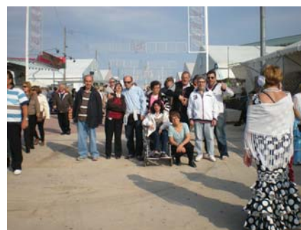
A la Fira d'abril