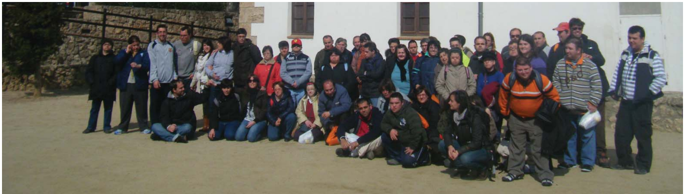
A la porta del Museu Paperer