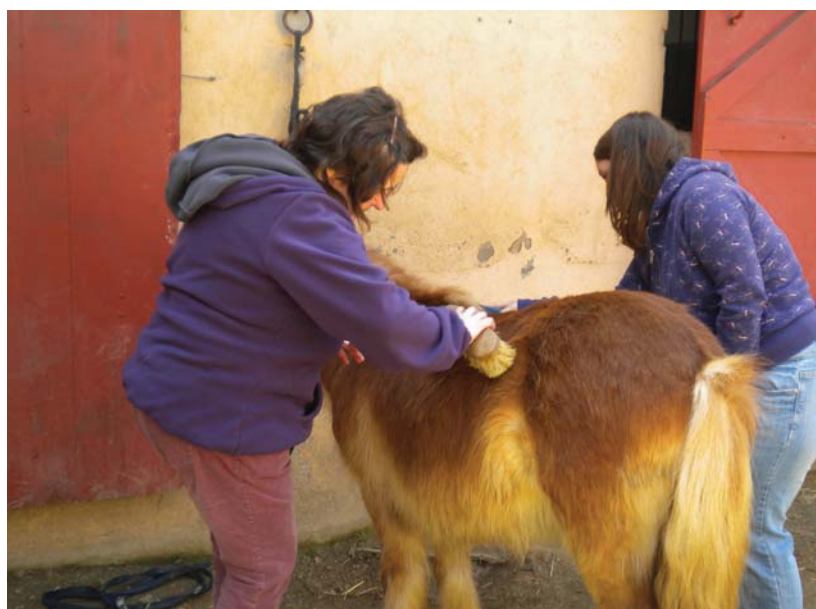
A la hipica