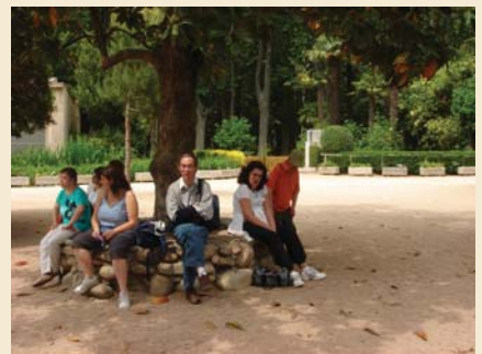
Preparats per acabar la visita i tornar al centre