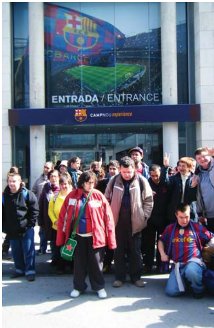
Ben equipats per fer una visita a Can Barça