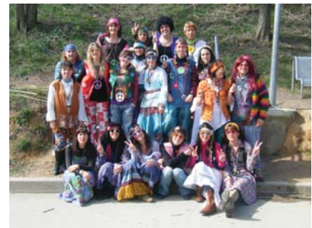
I els educadors d'allò més "hipie" per Carnestoltes