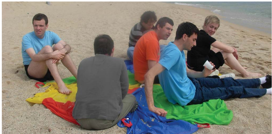
Vam dinar tots plegats

Tots van gaudir de l'experiència i van venir cansats però contents!