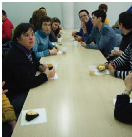
Ens van rebre molt bé!

La veritat que vàrem passar un matí fabulós, ens varen rebre amb els braços ben oberts i esperem poder fer el mateix amb ells quan puguin venir a veure'ns.