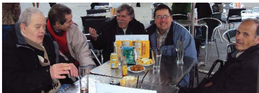
Vermut a Granollers