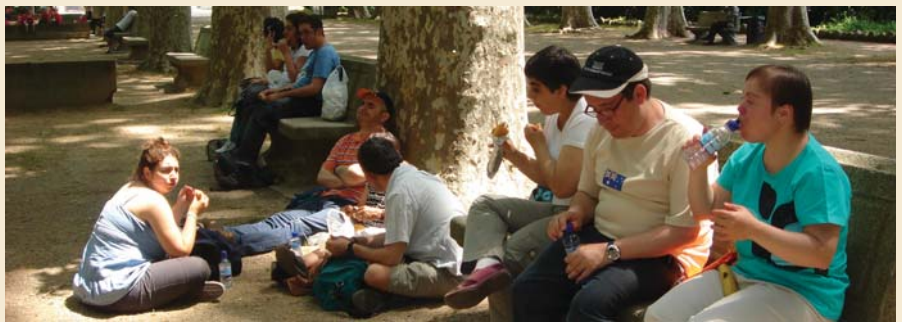
Una aturada per dinar

Els dies 12 i 13 de maig, diversos grups de l'STO del centre vam dirigir-nos cap al Mercat de les Flors amb alguns grups per visitar la ciutat tota decorada. Un cop allà, vam passejar pels carrers gaudint de les decoracions florals, feia molt bon dia i hi havia molta gent. Després, vam dinar al parc de la Devesa els pícnic que ens havíem endut del centre ocupacional i vam tornar al taller a mitja tarda.