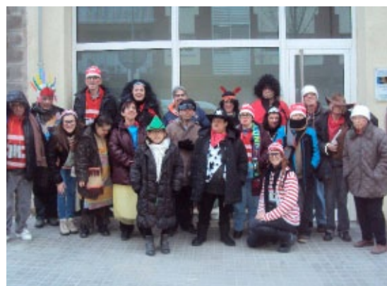
Tots cap a la rua de Carnestoltes