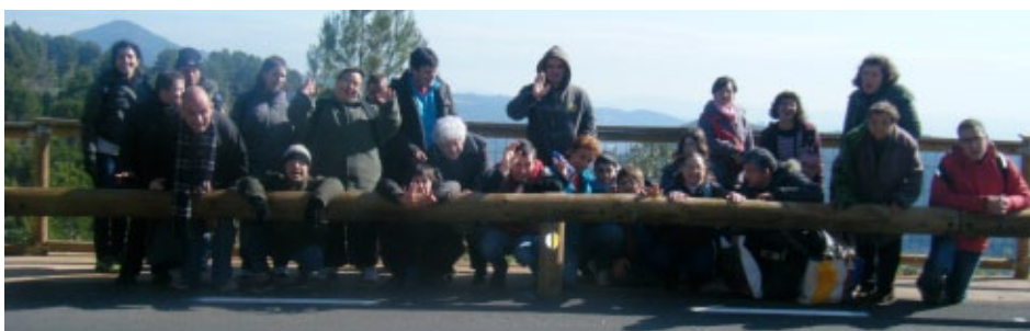
De camí a Sant Feliu

Com ja va sent habitual des d'uns anys ençà, 5 grups de l'STO vam anar a Sant Feliu de Codines pel dimarts de Carnestoltes, dia en que celebren l'Escudella Popular a la plaça del poble.