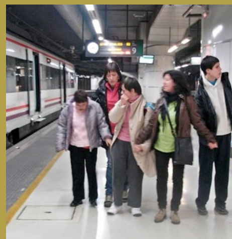
L'aventura al tren

Durant el partit van animar al seu equip, van cridar, aplaudir i s'ho van passar molt bé!. Gràcies a les voluntàries en nom de tots ells.