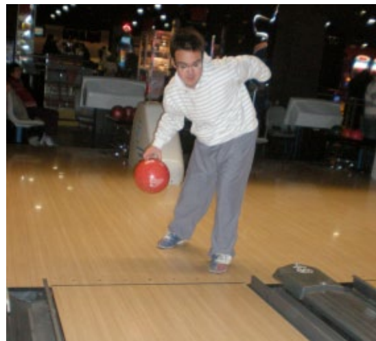
Jugant a bitlles amb estil