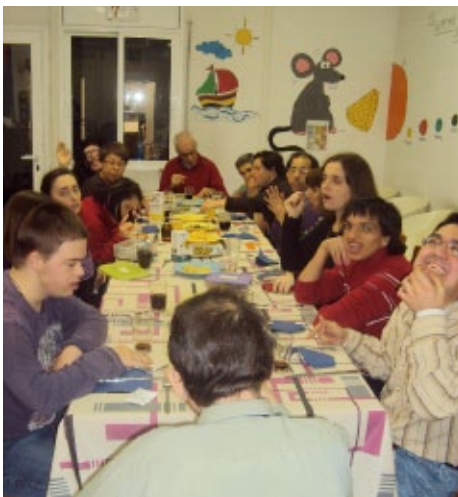
Sopar de cap d'any

Des de Nadal, anem fent sortides i activitats i ja estem esperant la primavera, amb ganes de sortir encara més.