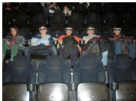
Una pel·lícula a l'Imax