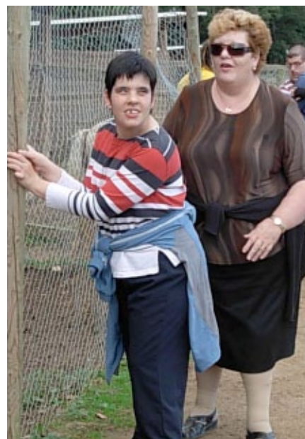
La Gemma gaudeix molt de les sortides