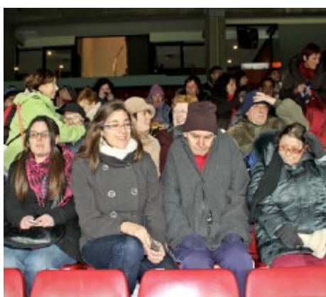
Esperant que comenci el partit

El passat dia 28 de novembre un grup d'usuaris van poder anar a veure el partit de Barça-Alavés al Camp Nou. Va ser una experiència molt divertida, i van fer molta gresca per animar al seu equip. Va ser un dia molt fred però tots anaven ben abrigats!