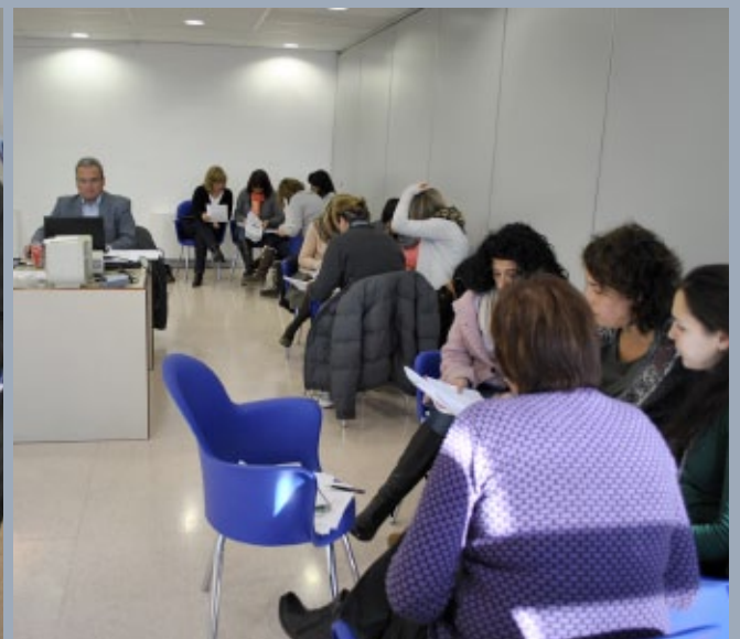
Un dels grups d'auditors interns en la sessió de formació realitzada al febrer