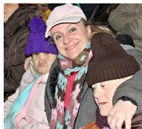
Feia molt fred