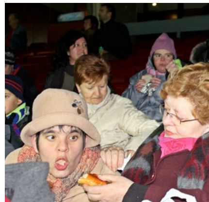
Al camp del Barça veient un partit!