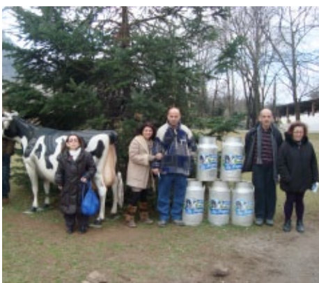
A la Fageda d'Olot