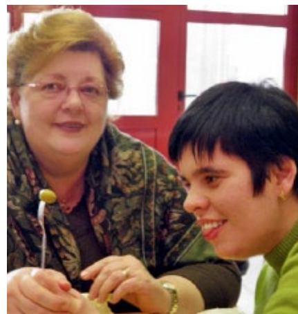
Cada dimecres, mare i filla berenen juntes a la residència