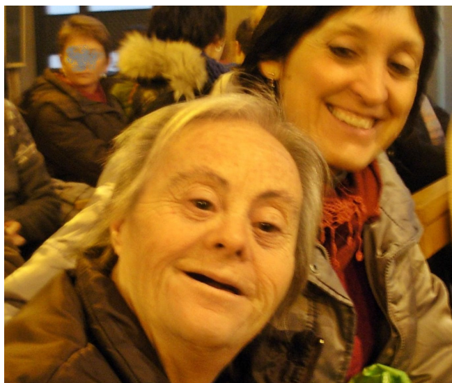
Moments previs al concert de Gospel