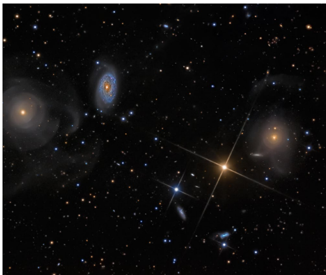
Fem astronomia al planetari del museu