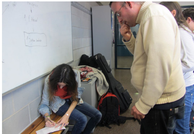
El grup de l’FVO amb la cantautora, Ivette Nadal

Al finalitzar l’entrevista, l’Ivette va obsequiar a cada un dels participants amb el seu primer àlbum “Guerres Dolçíssimes”. Tots van estar molt agraïts i contents; tanmateix, van aprofitar l’avinentsa per fer una roda de dedicatòries.