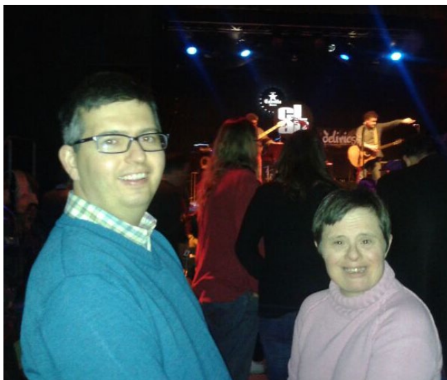
Gaudint de la música del "Disconcert"