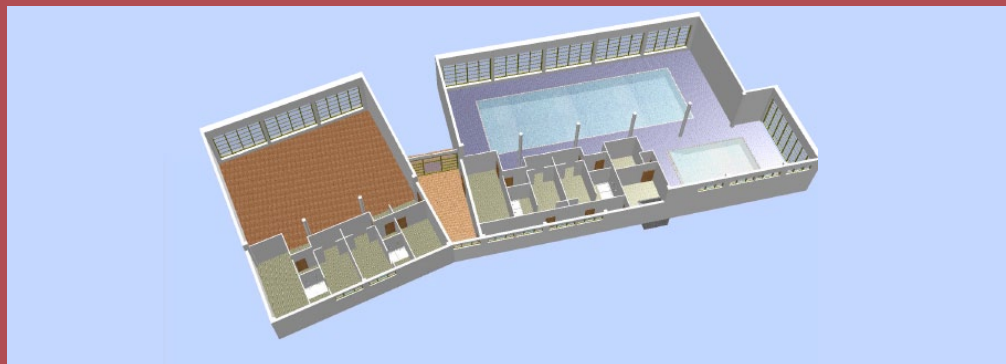
Avantprojecte del Centre de Rehabilitació Funcional