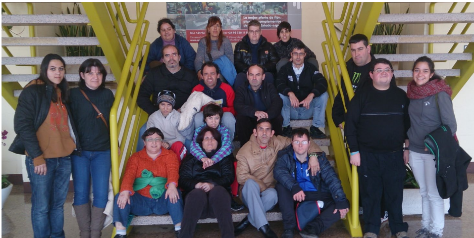
Participants de l'activitat "Projecte de Vida" que es va dur a terme al Mercat de Flor i Planta Ornamental

El passat 24 de febrer, diverses persones ateses al Centre Ocupacional i algunes monitores van realitzar dins el programa "Projecte de Vida" una sortida al Mercat de Flor i Planta Ornamental situat a la localitat costanera de Vilassar de Mar. Allà vam fer una visita guiada on ens van explicar tot el funcionament del mercat majorista. Al final del recorregut, ens van obsequiar a tots els assistents amb una flor i com a record, ens vam fer una fotografia tots plegats.