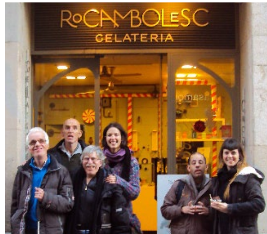
Fent un gelat a la ciutat de Girona