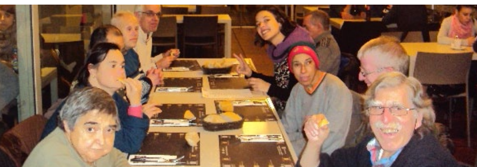
La festa de Carnestoltes (imatge superior) i gaudint d'un sopar de restaurant