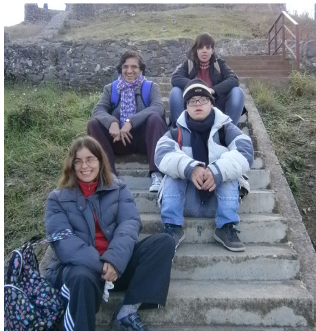
Excursió a Hostalric