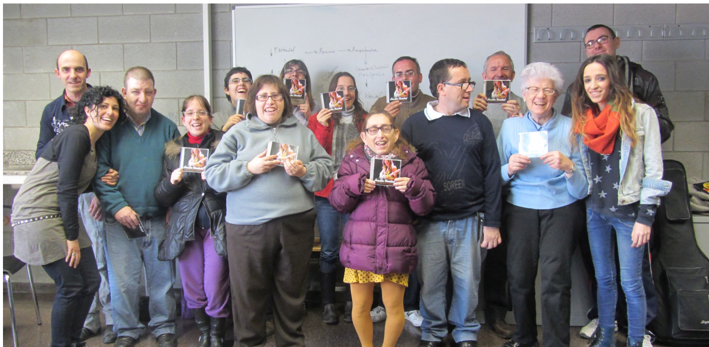
L’Ivette firmant el seu primer disc als participants de l’activitat