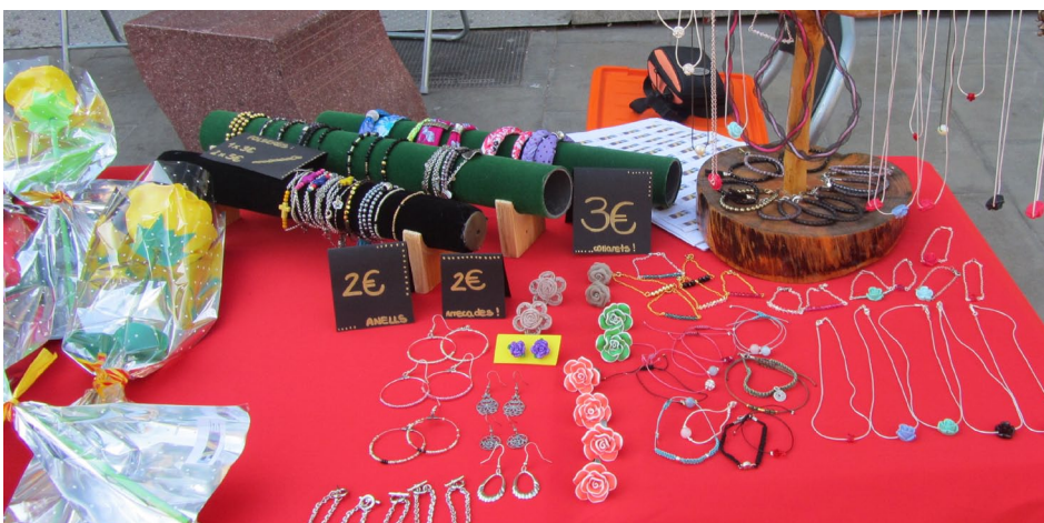
Parada de bijuteria i altres que es va realitzar davant l'espai el "GRA" de Granollers al 2013

Un grup del Centre Ocupacional format per en Jesús, la M a Àngels, la Núria, la Carme, la Yolanda, la Raquel i la Laura, i algunes monitores van anar el passat 20 de febrer a Barcelona per comprar material pel taller de bijuteria. Vam marxar tots junts i molt animats de bon matí amb la furgoneta per passar un dia diferent; fins i tot, ens vam emportar el dinar per aprofitar la jornada al màxim! Un cop a la capital, vam comprar material a diferents botigues que ja coneixem i que estan a prop de la Plaça Sant Jaume (tota la bijuteria que fem amb aquest material la podreu trobar a la paradeta que farem al mes d'abril per la festa de Sant Jordi). Quan vam acabar de comprar-ho tot, vam passejar per la zona i vam dinar a la Plaça de la Catedral, i per postres ens vam menjar un gelat que vam pagar amb els diners guanyats a la paradeta de Nadal. En definitiva, ens va fer un dia fantàstic i ens ho vam passar genial!