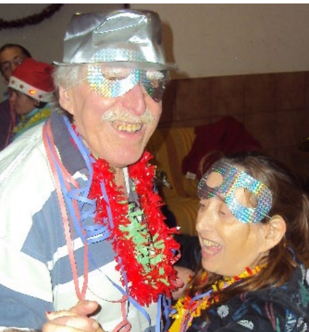
Ball a la festa de cap d'any

Ja han passat les festes de Nadal amb dinars, sopars, fires, cavalcades, regals, etc. i també el Carnestoltes. Ara amb el nou any i de cara a la primavera arriben noves visites, sortides i excursions!