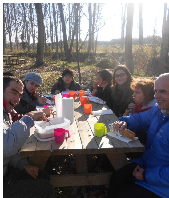
Recuperant forces a l'excursió de Vic