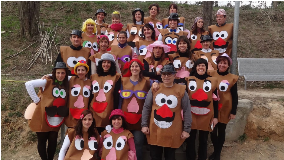
Professionals del Servei d'Atenció Diürna disfressats de "Mr. Potato Head"

Els Serveis d'Atenció Diürna van celebrar el passat divendres 28 de febrer la festa de Carnestoltes amb molta il·lusió i disbauxa. A primera hora del matí, ja es podien veure "patates" voltant per l'entitat, però no eren patates que s'assemblassin entre si, sinó tot el contrari, cadascuna estava personalitzada en funció del professional. Les disfresses recreaven la popular joguina infantil: "Mr. Potato Head". Les persones ateses als diferents serveis també es van disfressar, cadascú del que volia. A mig matí, es va organitzar un festeig als tallers del Centre Ocupacional amb música i aperitius! Podeu trobar més fotografies a la nostra pàgina de Facebook: "Fundació Fvo".