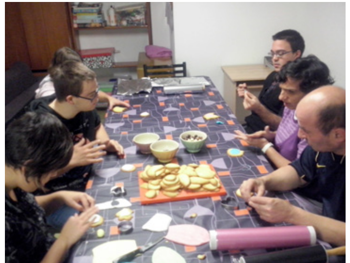
Fent galetes de Halloween