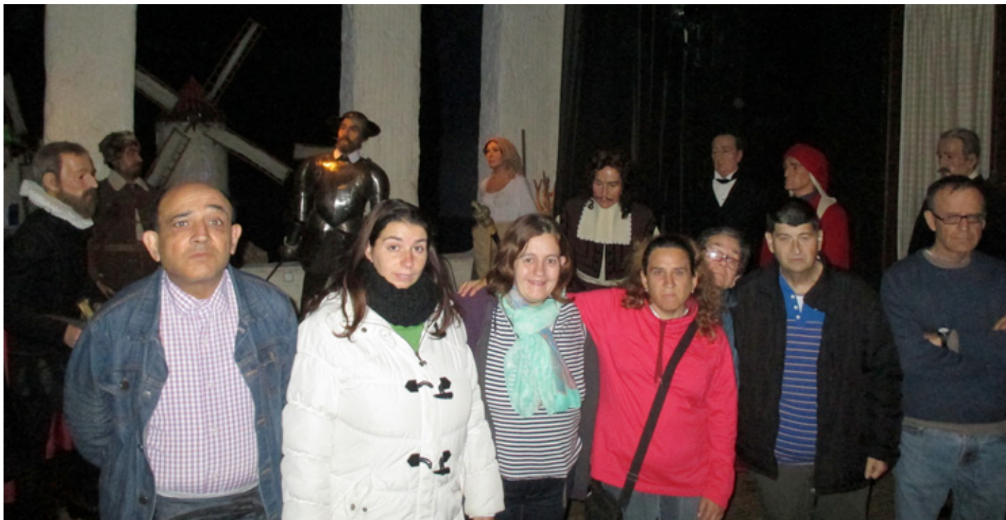
Sembla que formem part del Museu de la Cera