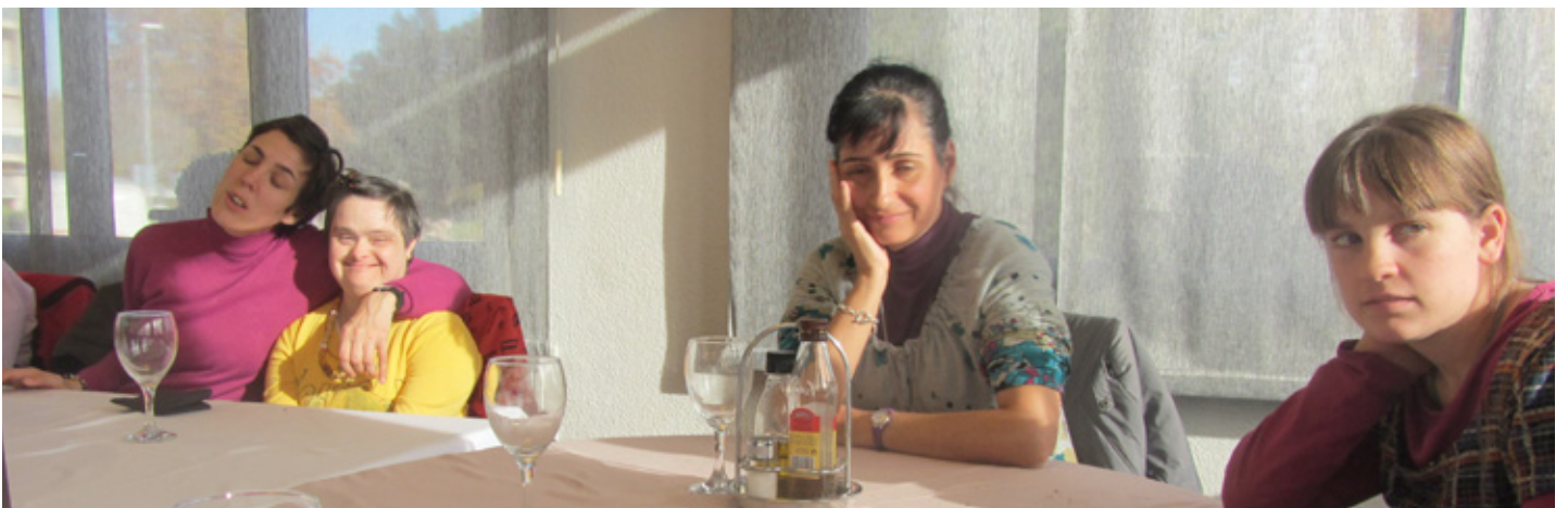
Dinars del taller de bijuteria