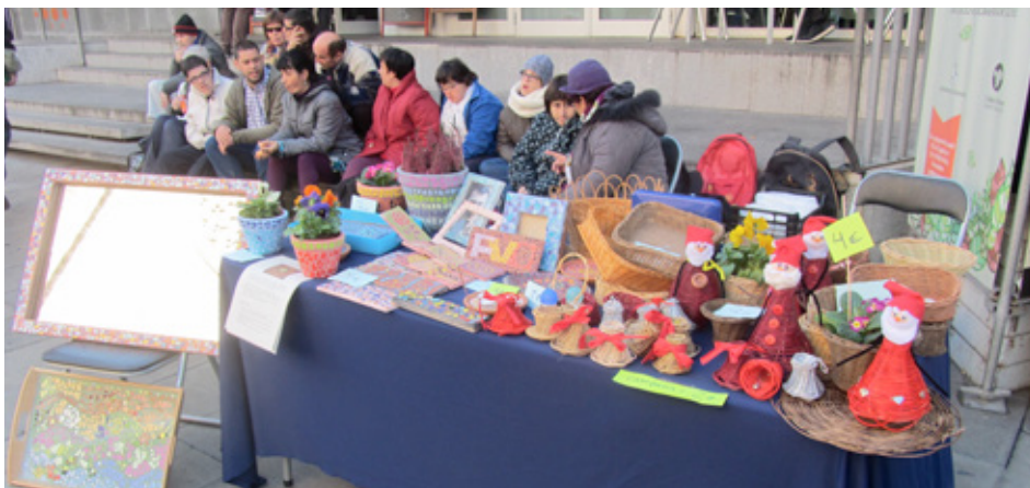
Parades de vímet i trencadís a Granollers