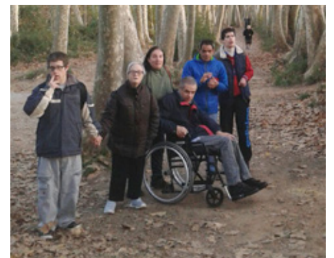
Gaudint dels dies de bon temps de la tardor