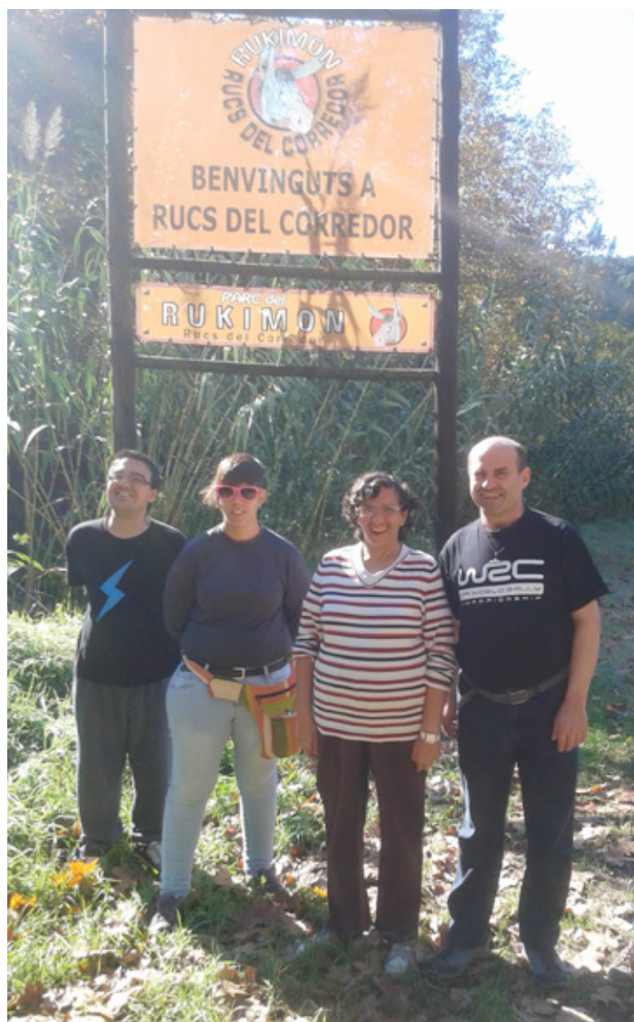
Al Parc del Rukimon