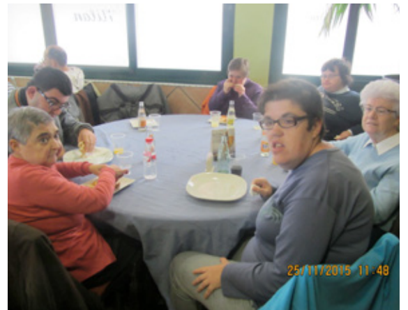
Esmorzar del taller de viñet