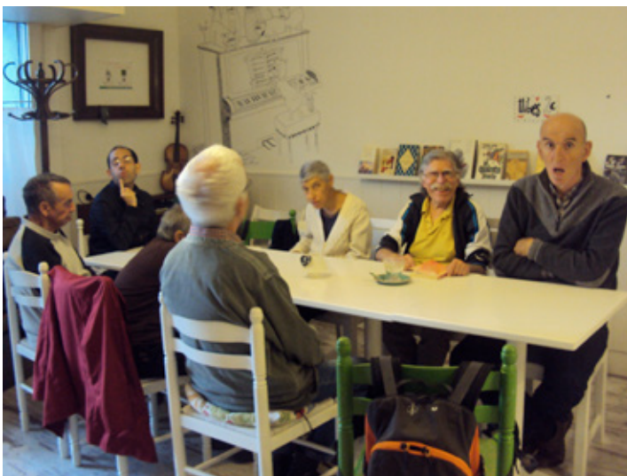
Fent un café al Gato Verde