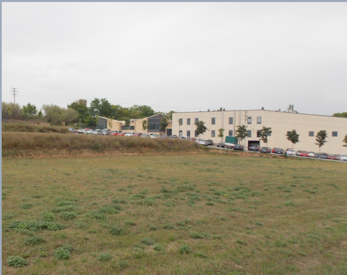
Terrenys de la Fundació on es construirà el futur Centre de Rehabilitació Funcional

Des de la Comissió Tècnica s'ha anat fent el seguiment i la coordinació de les actuacions realitzades des de la subcomissió i que actualment està a punt de finalitzar el manual