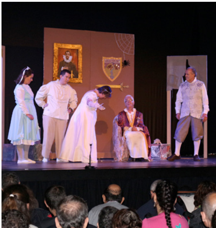
Els personatges principals de l'obra defensant les bondats d'ésser nets i polits