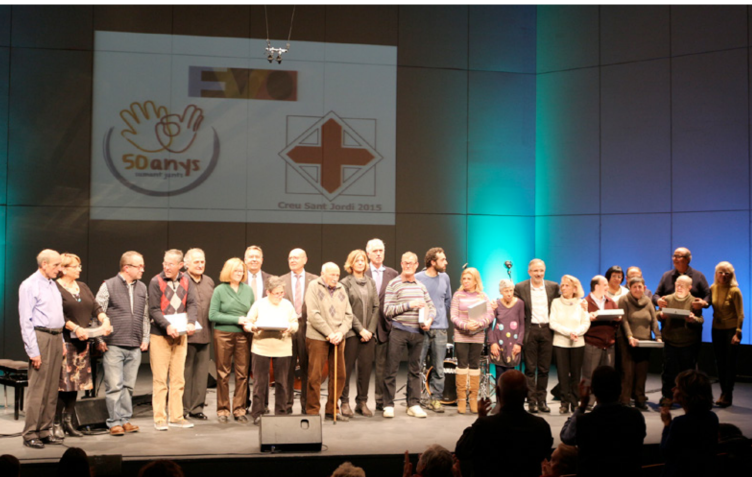
Un reconeixement a les famílies de la Fundació