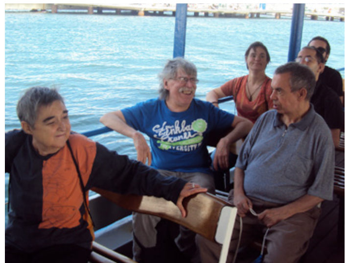
Un viatge en "golondrina"