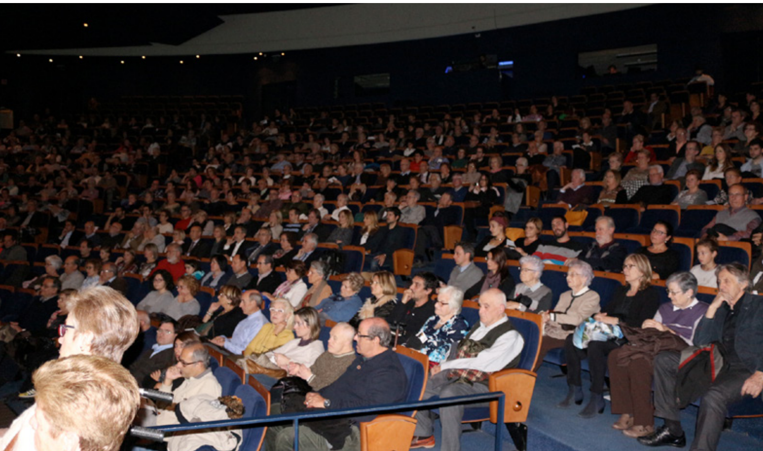
Els assistents van acompanyar a la Fundació en el tancament dels actes del seu cinquantenari