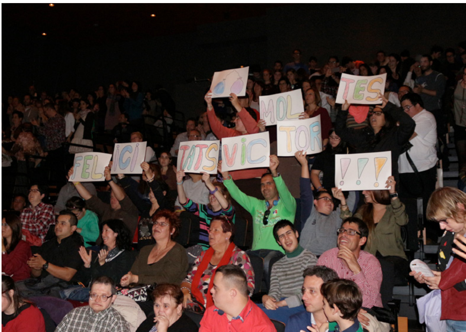
L'estrena d'enguany ha agradat moltíssim