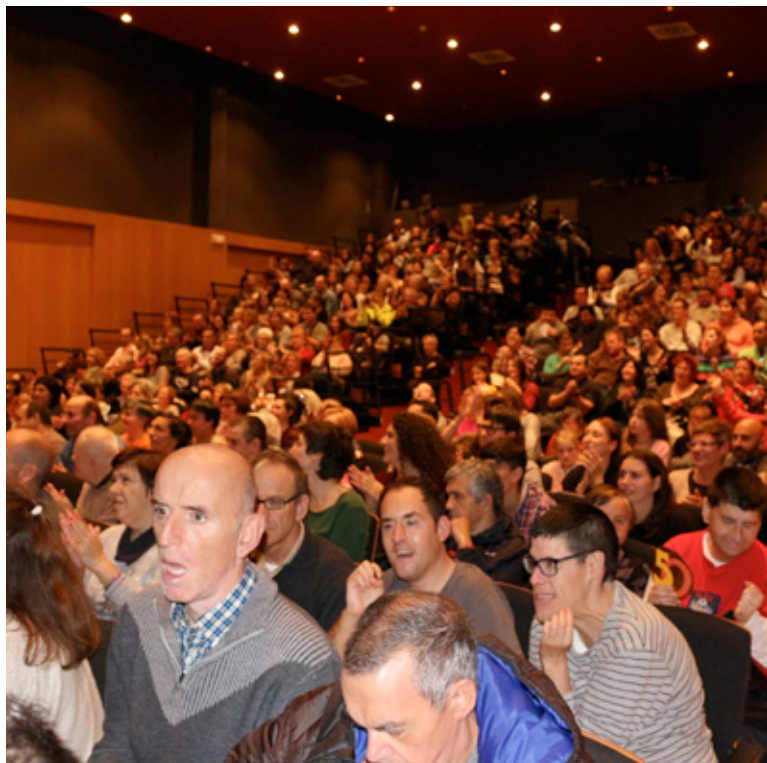
Màxima assistència a l'estrena de l'obra