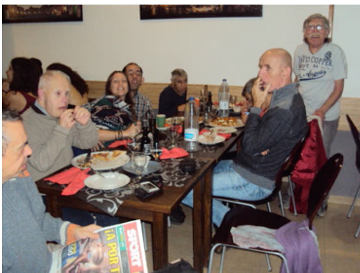
Sopant amb bona companyia