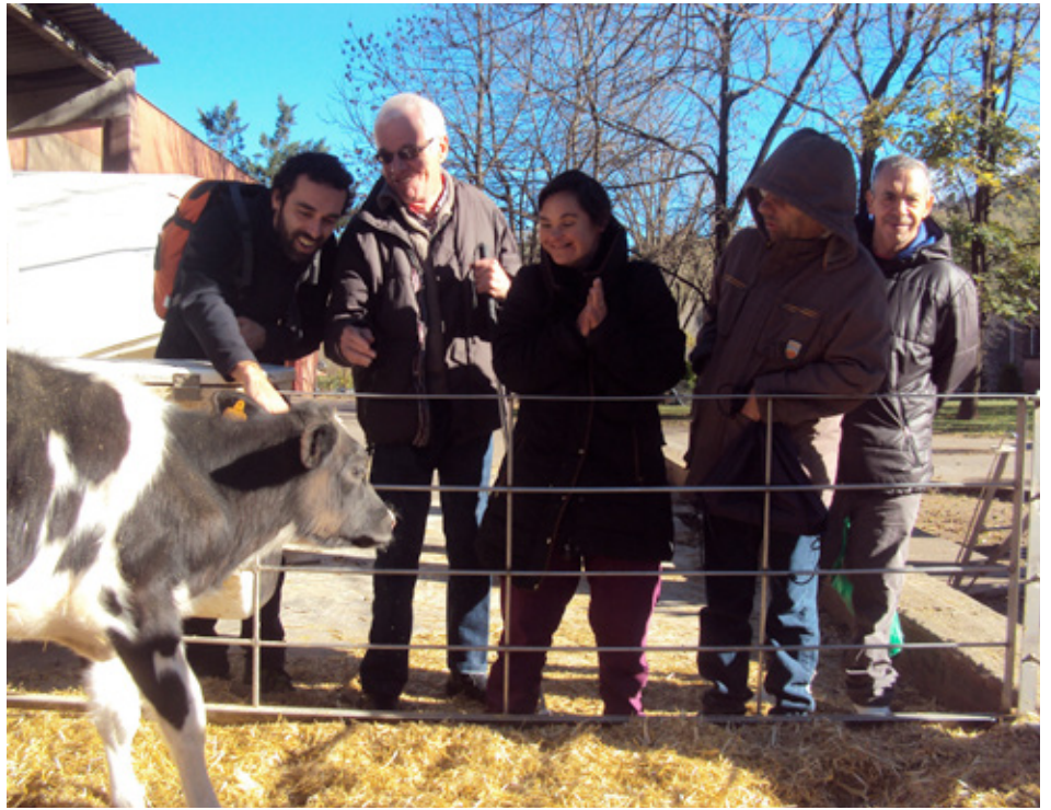
A la fageda d'en Jordà

Els mesos de tardor ens han servit per fer un munt d'activitats al Servei d'Habitatge aprofitant que encara fa bon temps i que hi ha moltes celebracions com la Castanyada que ens ho fan passar d'allò més bé!