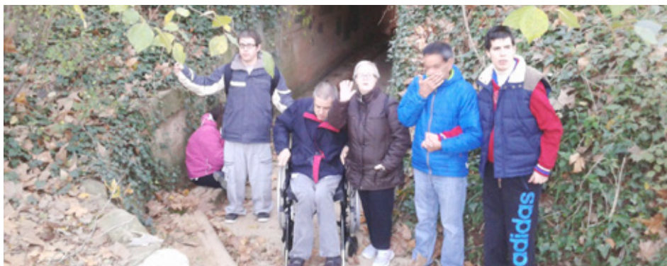
La tardor en plena natura

Un grup de persones ateses a la Residència van anar al Parc Natural de Gallecs i van gaudir d'un dia de tardor en plena natura. Les fotos ens mostren que s'ho van passar genial!