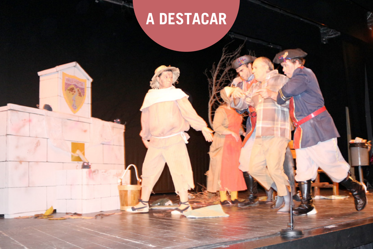
Escena de la rebel·lió a Vallneta