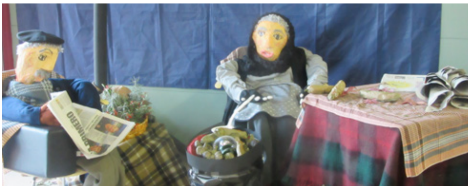
Els castanyers d'enguany i la paradeta dels castanyers