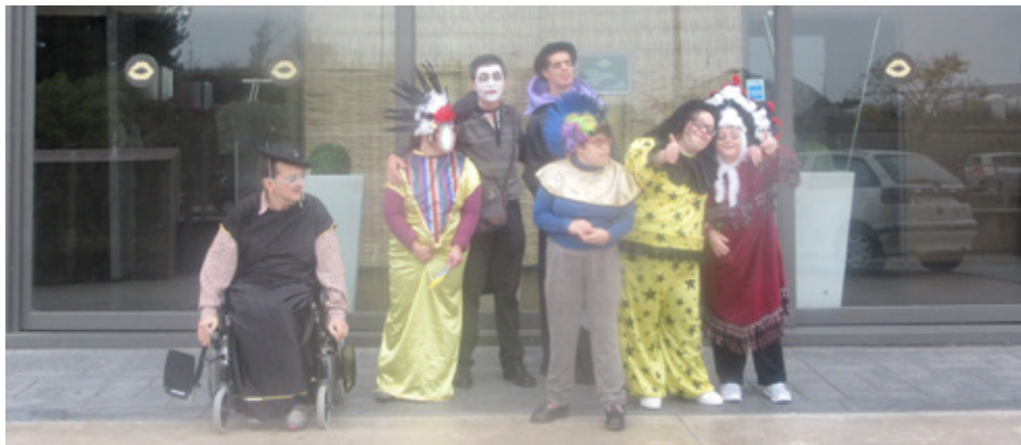
Celebrem el Halloween tot ballant