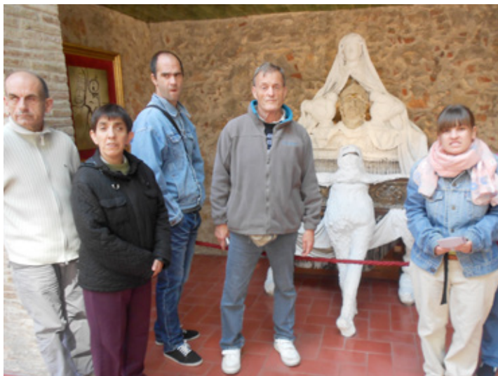
Al Museu Dalí de Figueres