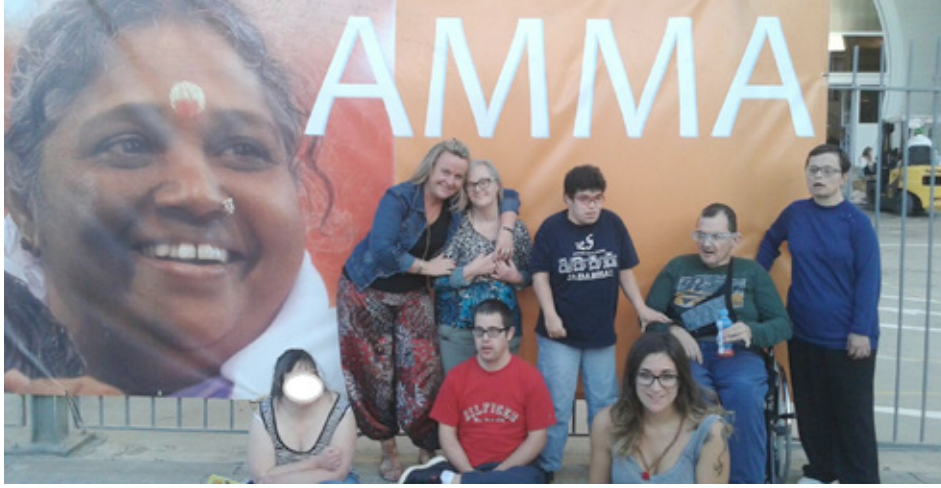
Preparats per les abraçades