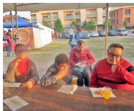
La sortida a la Fira Medieval i el taller de bombolles gegants durant la sortida a Bigues i Riells