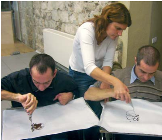
Creativitat a la visita al Museu de la Xocolata

-Els usuaris/àries d'STO han iniciat l' activitat optativa de piscina , a les Piscines Municipals de Granollers. Mes d'octubre.