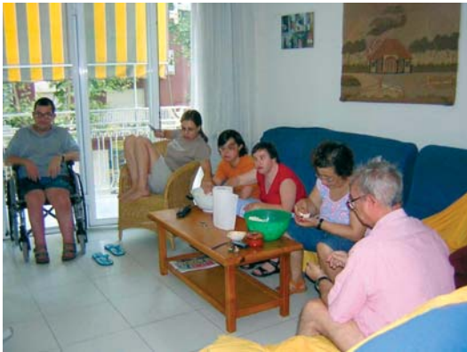
Residents de la Llar Font Verdà fent activitats domèstiques quotidianes

Personal: 292 hores/usuari/any. Si atenen persones amb problemes de salut mental, comportament o envelliment: 963