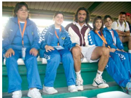
El conegut tennista Sergi Bruguera, molt ben acompanyat

Paral·lelament es van organitzar activitats de lleure amb caràcter cultural i recreatiu durant tots els dies dels Jocs al voltant de