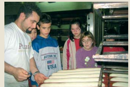
A Can Bretxa fent panellets