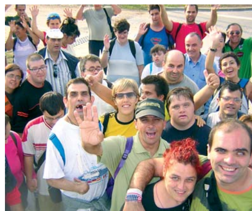
Sortida al Parc de Can Cabanes per gaudir de la natura

-Els grups de SOI van anar a fer un pícnic al Corredor del Montnegre. 6 d'octubre.