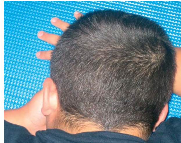
Ajuda'm a mirar, ajuda'm a entendre

i disminuir-ne la freqüència. Dins del Centre d'Educació Especial, és aquest un dels handicaps més complexos d'abordar, donat que les eines educatives contemplades en els Programes escolars, no parlen amb claredat de les estratègies a desplegar en casos de Trastorns greus del Comportament. No només no s'especifica què fer amb l'alumne disruptiu sinó que no s'explica com el professional pot evitar les conseqüències negatives per a la resta d'alumnes que són presents o bé són víctimes directes de la conducta perturbadora. És aleshores quan en el Centre es dissenyen internament estratègies molt específiques per a cada cas, si bé la seva aplicació representa moltes vegades un desplegament de