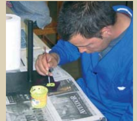
Usuari del Centre Ocupacional fent activitats d'ajust personal i social

La Fundació Privada Vallès Oriental disposa d'un Departament de Treball Social, que acompanya a les famílies i els usuaris en les possibles necessitats socials que sorgeixin al llarg de les diferents etapes viscudes, a l'Escola, als Tallers, a la Residència, al CAE o a les Llars. També s'ofereix un suport respecte al tràmit de pensions o ajudes, serveis externs que es requereixin en cada situació, o qualsevol altra informació relacionada amb l'àmbit de les persones amb discapacitat intel·lectual.