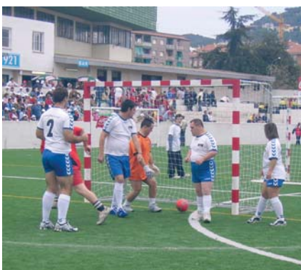
Esportistes de l'FVO durant un partit de futbol sala