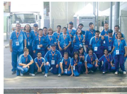
Delegació que representava l'FVO al complet