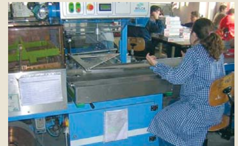
L'acord significa una millora del creixement de l'ocupació

ment les prestacions per a desocupats i es protegeixen les situacions d'indefensió dels treballadors en cas d'insolvència empresarial a través de millores del Fons de Garantia Salarial en casos d'insolvència empresarial. D'altra banda es dedicaran esforços a innovar, desenvolupar i implantar polítiques actives d'ocupació basades en la formació, com a eina indispensable per a la qualificació dels treballadors. Finalment es preveu dissenyar un pla de modernització dels serveis públics d'ocupació per dotar-los de més i millors recursos materials, tecnològics i humans, capaços d'oferir un servei de qualitat als usuaris, captant necessitats del mercat laboral i incentivant els desocupats a la recerca de feina. Tot plegat, un projecte ambiciós que requereix un gran esforç pressupostari i un increment substancial dels recursos materials i humans que encara avui dia no estan disponibles. Una mesura catalogada per alguns de precipitada, ja que a mesura que es va implantant, ja s'està modificant per no haver considerat a priori tot el ventall de situacions possibles. I qualificada per altres d'insuficient ja que no aborda directament la causa del problema de la temporalitat i no permet la flexibilitat que demanda el mercat laboral actual.