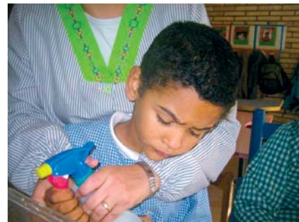
De vegades ens resistim a mirar

Què fer? Què pensar? Com sentir-se? El que en un principi s'interpreta com a temperament o bé com a trets habituals del nen amb dificultats intel·lectuals, fa que els pares modifiquin la seva forma de tractar-lo, de vegades protegint-lo, de vegades disciplinant-lo, si bé en qualsevol dels casos, quan es tracta d'un trastorn greu de la conducta, els resultats no són gens satisfactoris i aquell fill, per sobre de tot tant estimat, altera la convivència de tal forma que sembla impossible gaudir d'ell com tots els pares voldrien. La por d'ésser jutjats fa de vegades que els pares no expressin clarament el que estan vivint a casa, on les conductes acostumen a ser com a mínim les mateixes que les del centre escolar i no arriben a coordinar-se família i escola fins al moment en que determinats comportaments es fan insostenibles. Els professionals sabem com és de dolorós per a les famílies sentir-se incapaços de corregir les conductes disruptives del seu fill/a i també sabem que quan els fem saber el que està succeint a l'escola, els pares no ignoren que és fruit d'un trastorn que el seu fill no pot rectificar fàcilment. És evident que només amb una xarxa de comprensió mútua entre tots els adults que envolten el nen o noi amb Trastorns de comportament se'l pot entomar i dissenyar estratègies per a actuar amb ell.