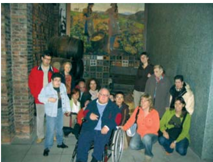
Excursió a les Caves Codorniu

El dia 8 de novembre van fer una petita excursió a les Caves Codorniu de Sant Sadurní d'Anoia. Van gaudir de l'excursió un total de 9 usuaris, que van anar fins allà en dues furgonetes de la Fundació. Un cop arribat a les caves ens estava esperant un guia molt simpàtic que ens va portar a conèixer-les per dintre. Vam baixar sota terra i allà hi havia milers d'ampolles de cava en procés d'elaboració. Vam pujar en un trenet que va recórrer més d'un quilòmetre per sota terra i ens van ensenyar els llocs més emblemàtics i curiosos. Va haver-hi un moment que teníem una gran extensió de vinyes al damunt nostre, imaginar-ho va ser espectacular. Un cop finalitzada la visita ens van donar uns petits obsequis per a tots. Es va fer l'hora de dinar i tots plegats ens vam desplaçar fins a un restaurant de Sant Sadurní on vam menjar estupendament. Ja es va fer l'hora de tornar, així que vam agafar les furgonetes i cap a casa, però això sí, tots tornàvem molt contents d'haver passat un bon dia en bona companyia i