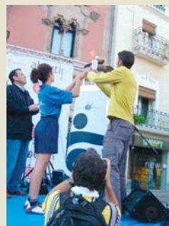
La torxa olímpica

-El cantó verd del pavelló 1 va anar a muntar a cavall a l' hípica de Santa Susanna .