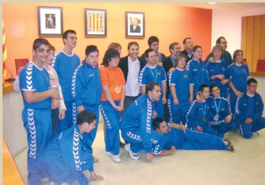
Els esportistes de l'FVO durant la recepció a l'Ajuntament de Granollers

El 5 de desembre la Sala de Plens de l'Ajuntament de Granollers es va organitzar una recepció en la qual els integrants del Club Esportiu FVO van rebre el reconeixement del consistori per la seva participació als Special Olympics celebrats a Lloret de Mar el passat mes d'octubre. Tots els esportistes