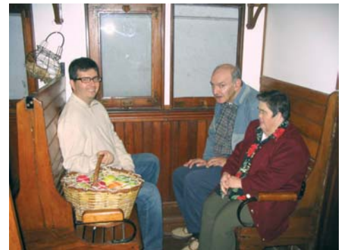
Excursió al Museu del Ferrocarril

rock Esto No Es Serio Band, i el segon d'un grup musical anomenat Gospel Sounds. Van ballar i prendre un refresc, i després van sopar pels voltants de Mataró.