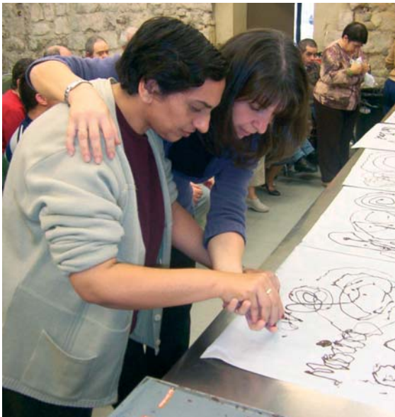
Sortida al Museu de la Xocolata

que s'observa entre diferents persones que presenten trastorns de conducta, i és que cadascú els manifesta segons la seva personalitat, la seva manera d'encarar els conflictes, les seves capacitats... En definitiva, als Tallers entenem els trastorns de conducta, no pas com una patologia en si mateixos, sinó com un símptoma que pot estar expressant o ésser indicatiu de moltes coses possibles. Així, fent un paral·lelisme arriscat amb la medicina podríem dir que els trastorns de conducta són a nivell mental allò que podria ser la febre a nivell físic, i és des d'aquesta perspectiva que els professionals dels Tallers els valorem,