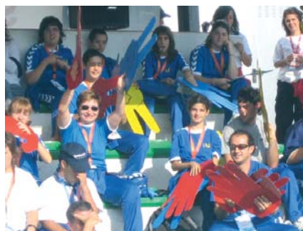
Representants de l'FVO donant suport amb el material elaborat a la Residència i Centre de Dia Vallldoriolf

les principals seues esportives que van ajudar a fer dels Jocs la gran festa de l'esport. Els diferents esports i activitats de lleure es van plantejar com un espai privilegiat de convivència i diversió compartida entre els esportistes i la població de Lloret de Mar. Els nois i noies van poder gaudir de la companyia d'esportistes de fama reconeguda, personatges de les sèries de TV3 i sobretot de les famílies que van estar cada dia al seu costat donant-los el seu suport.