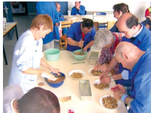
Elaborant un pastís per celebrar la Castanyada