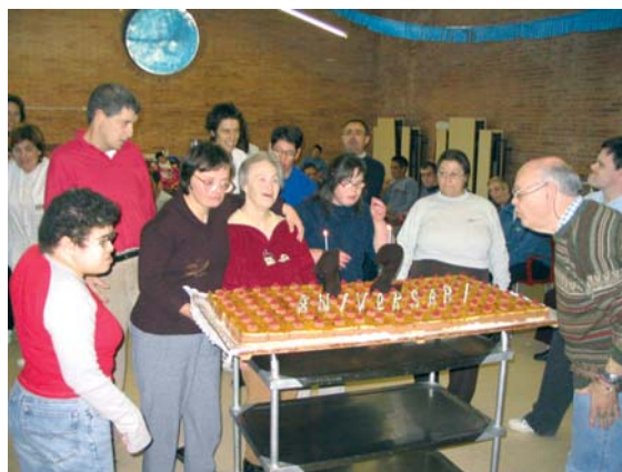
Festa del 12è aniversari de la Residència i Centre de Dia