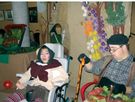
Festa de la Castanyada

A les 15 hs, va tenir lloc la tradicional foto de grup. A la tarda entre tots vam bufar les espelmes del gran pastís tot desitjant molta sort per tots. Per recordar aquest dia tant especial es va fer un mural on tots els usuaris i treballadors van plasmar la seva empremta.