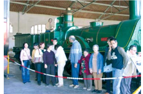
Excursió al Museu del Ferrocarril

És una proposta del grup Taller d'Idees (Treballadors de Fundació Maresme), en la qual organitzen un concert mensual (diumenge tarda) per afavorir la integració social de les persones amb discapacitat intel·lectual. Els nostres usuaris han gaudit de dos concerts: el primer d'una banda de