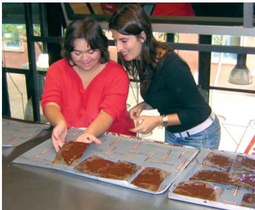
Gaudint d'un dia dolç, treballant i assaborint xocolata

-Hem començat a participar en les activitats organitzades per l'Associació Cultural de Granollers :