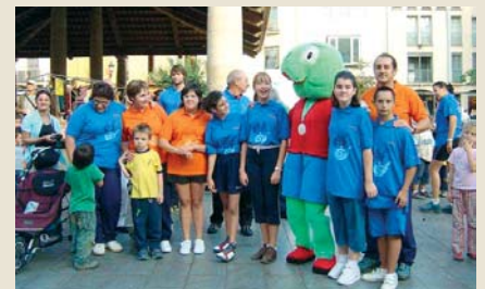
Tots junts amb la mascota dels Special Olympics