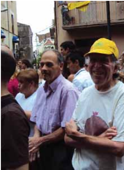
De Festa Major a Cardedeu

A l'estiu és època de Festes Majors, hem anat a diverses de tota la comarca.