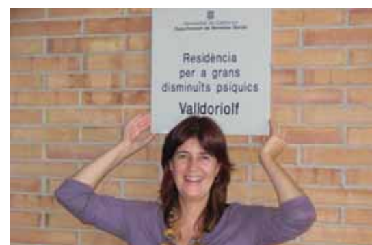
Tot l'equip de l'FVO et volem desitjar molta sort en la teua nova etapa professional

Aprofito per donar-vos les gràcies, a vosaltres companys de la residència i de tots els diferents serveis de la Fundació, familiars i caps, per a tots els bons desitjos, mostres d'afecte i suport que m'esteu donant, tot plegat m'ha fet veure i sentir, que després de tants anys en aquesta empresa, estic molt ben acompanyada.