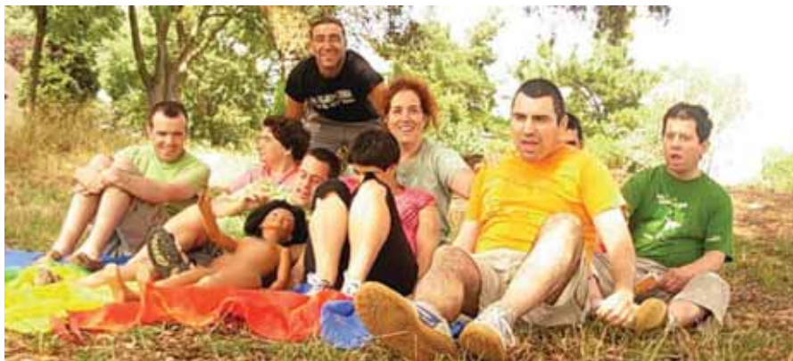
Gaudint de l'ombra dels pinetons