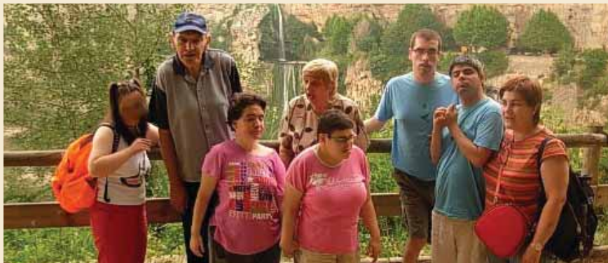
Tots junts a Sant Miquel del Fai

El passat 15 de juliol un grup de 7 usuaris de la Residència i Centre de Dia "Valldoríolf" vam anar fins a St. Miquel del Fai per tal de passar un dia en plena natura i gaudir d'uns paratges meravellosos. Vam sortir d'aquí cap a les 10,30 del matí amb la intenció d'estar aviat allà i poder fer algun recorregut i buscar un bon lloc amb ombra per a fer el "pica-pica" i dinar tranquil·lament a l'ombreta. Cap a les 17h tornàvem cap a la residència. Vam poder passar un bon dia tots junts.