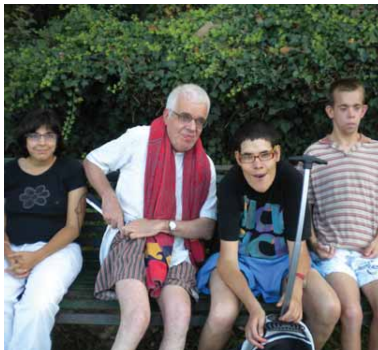
Preparant-nos per la remullada