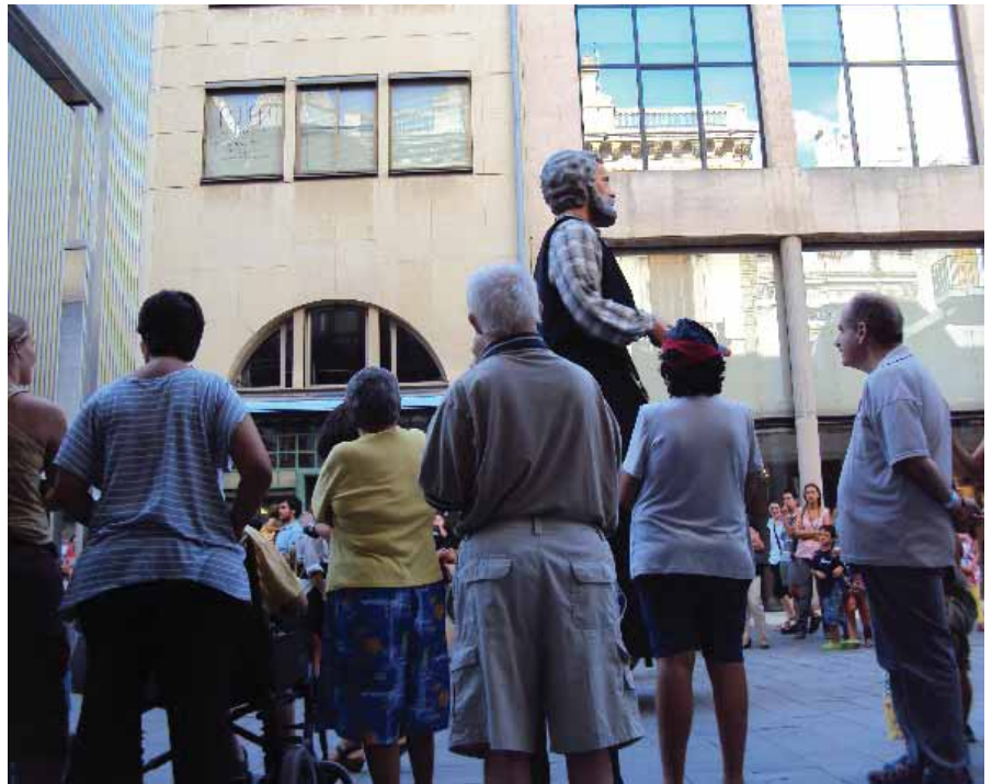
Festa Major de Granollers