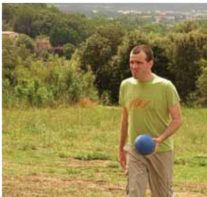
Vam aprofitar per fer uns quants jocs amb pilotes

Va ser un dia molt agradable i tots van gaudir molt.