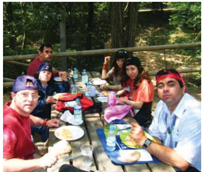
A punt pel dinar