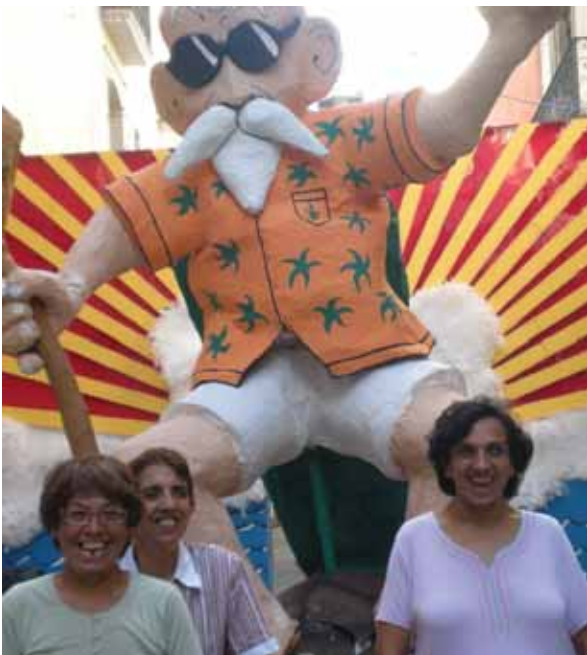
Festa Major de Gràcia 2010