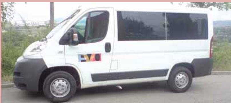
La nova furgoneta de l'FVO

L'FVO i l'Obra Social de "la Caixa" han establert una nova col·laboració per a potenciar el programa de Voluntaris de l'FVO a través de la compra d'una nova furgoneta per a donar suport a les sortides i activitats que es realitzen des del Servei d'Habitatge i on s'incorporen a donar suport les persones voluntàries.