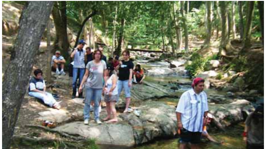
Passejant pel parc

Després de dinar, res millor que una bona passejada pel parc seguint l'itinerari senyalitzat gaudint de l'entorn i de la bona companyia..