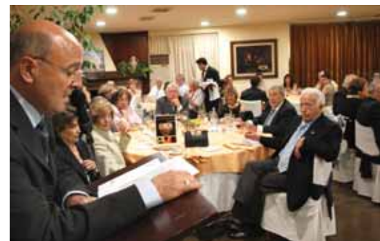
El model de Gala Social ha canviat per convertir-se en "El Dia de la Fundació"

Fa més de setze anys que l'FVO organitzava l'edició anual de la Gala Social, amb l'objectiu de recaptar fons per a l'Escola d'Educació Especial "Montserrat Montero". Actualment, la Fundació s'ha centrat en acompanyar a la persona amb discapacitat intel·lectual en la seva etapa de vida adulta i és per aquest motiu que l'acte social també evoluciona. Amb el mateix esperit de compartir un acte amb tots els amics i amigues de l'FVO neix "El Dia de la Fundació".