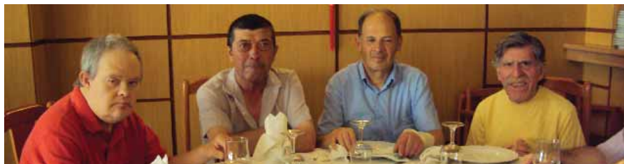
A taula per tastar el menjar xinès