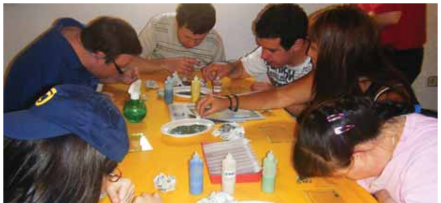
El taller de manualitats