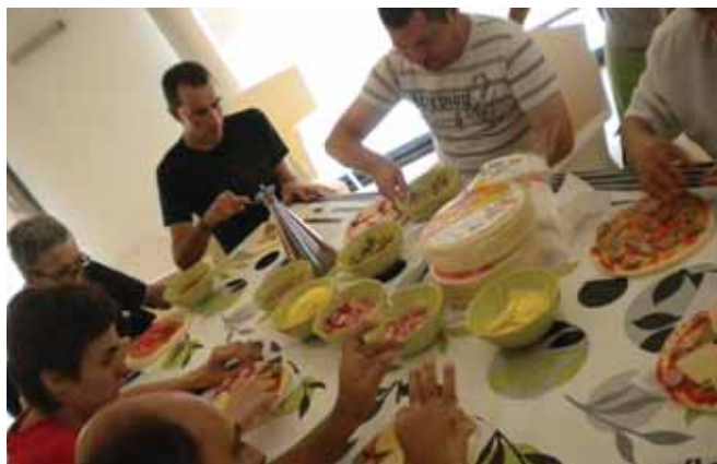
En plena elaboració d'una pizza casolana