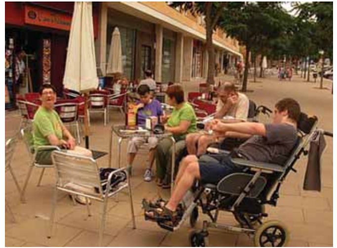
Tots junts prenent un refresc