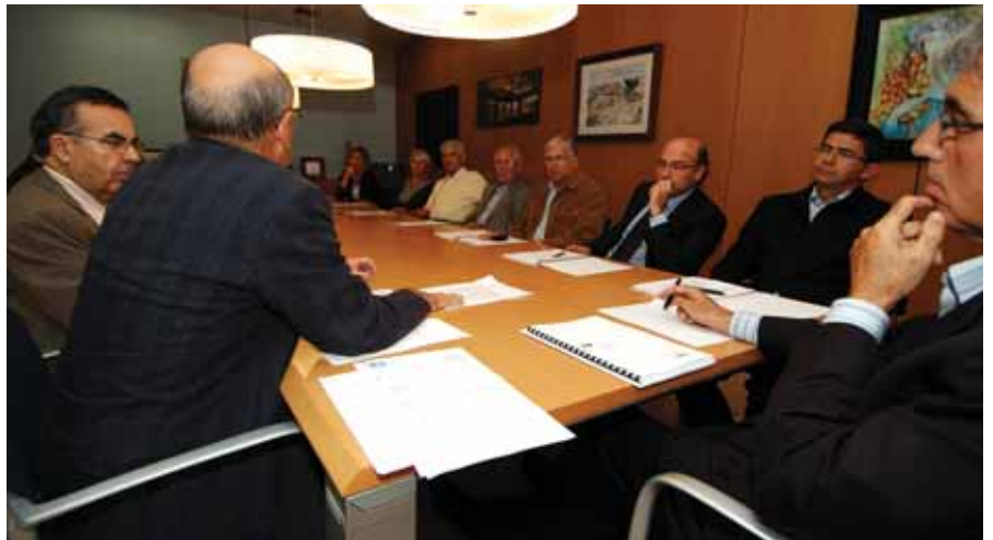
El Patronat de l'FVO crea el Consell Consultiu per enriquir-se amb noves opinions i punts de vista