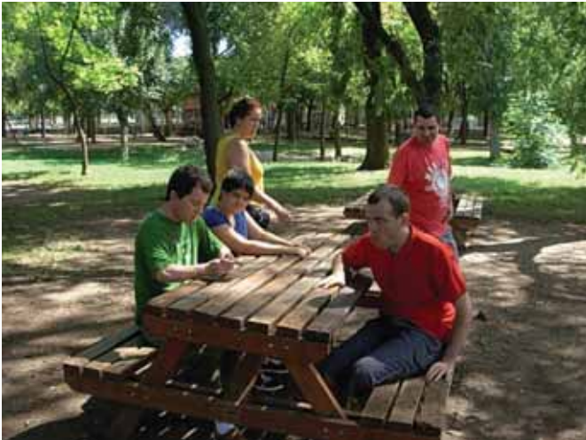
Sortides als parcs del voltants