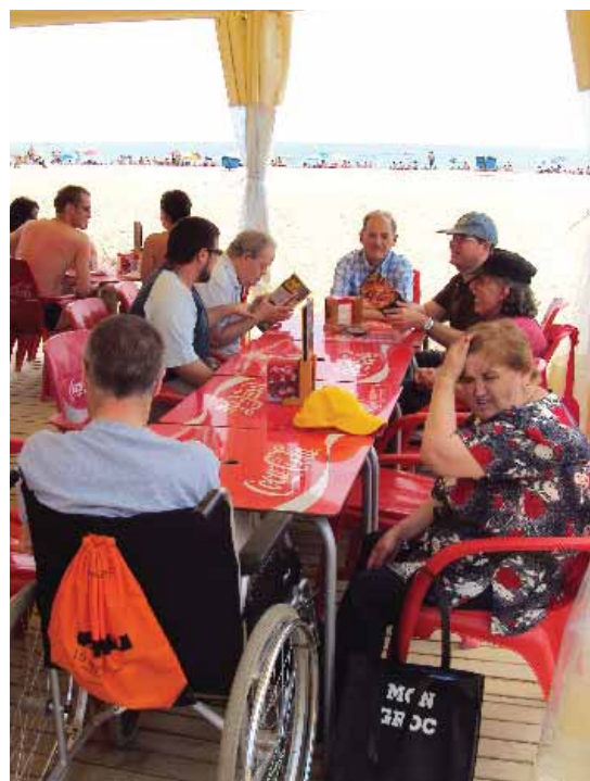
Dinar a la platja d'Ocata