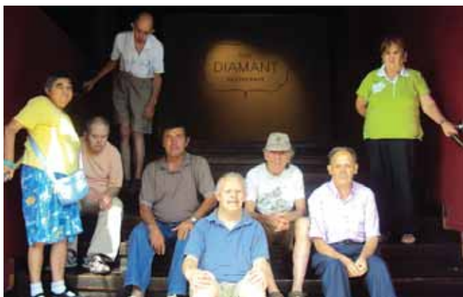
A punt per tastar un bon àpat

Alguns cops ens hem permès d'anar a un restaurant a menjar, però a les diferents llars també ens agrada participar i cuinar, com en aquest cas a fent unes pizzes.