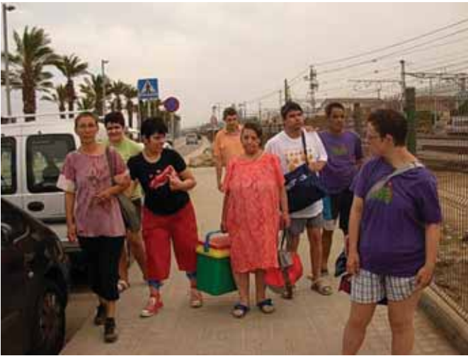
Preparats per a passar una estona a la platja

van sortir el divendres 27 d'agost, dia en que es fan més activitats, també va coincidir amb un dia força calorós d'aquest estiu. A la tarda un grupet vam anar fins al centre de la ciutat on van gaudir d'alguns espectacles que s'estaven portant a terme al carrer i per a refrescar-nos vam anar a prendre un refresc. Quan ja estàvem cansats i necessitàvem recuperar forces vam anar a sopar a un restaurant proper.