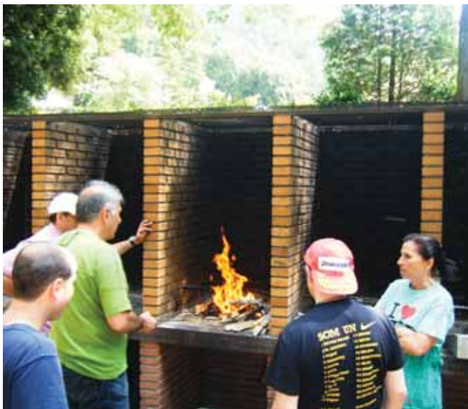
Preparant les brases