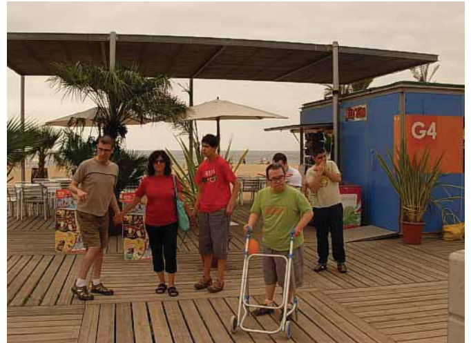
Caminant pel passeig marítim de Mataró