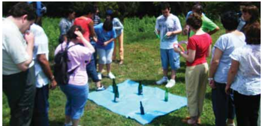
Jocs a l'aire lliure