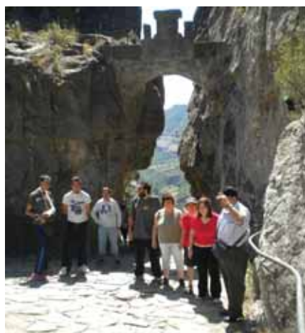
Sant Miquel del Fai