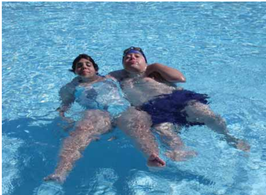
En plena remullada