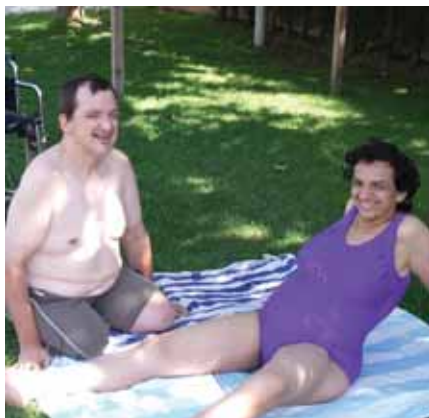
Descansant a la piscina