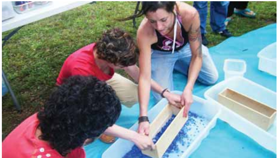
Preparant un cendrer de vidre

Tus monitores y compañeros del Centre Ocupacional.