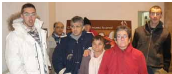
I el de la xocolata