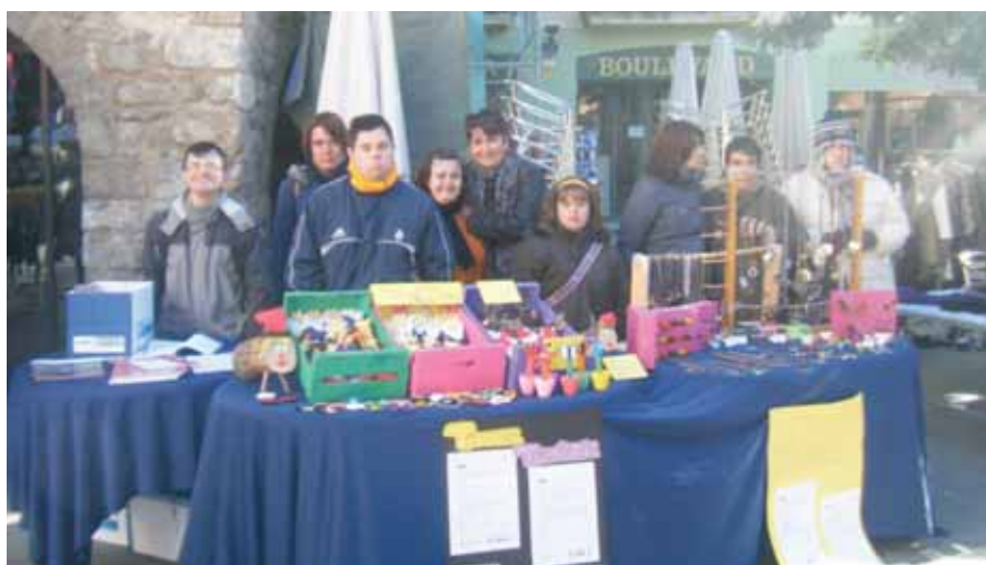
La parada amb la feina feta al Centre Ocupacional

Va ser un gran dia en el que vam poder mostrar la feina que fem al CO, que no és poca! ens ho vam passar genial i segurament el trimestre que ve repetirem si seguim treballant de valent!