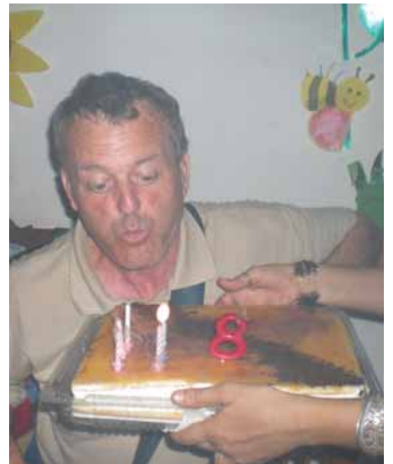
De celebració amb els companys de la llar

A Sant Antoni estic apuntat al Casal d'Avis i faig moltes activitats amb ells, com per exemple, visitar el camp del Barça, caminades,