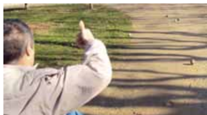
La petanca al parc

Anem al teatre, als concerts, als museus, al cinema, però també estem a l'aire lliure, fem esport.