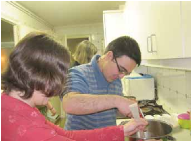
A la llar cal cuinar, o fer magdalenes

A la llar cal cuinar, o fer magdalenes i pastissos