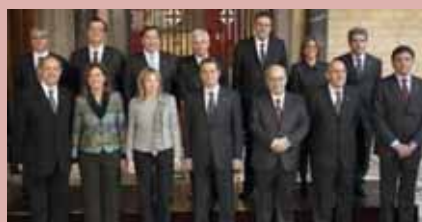
El nou Govern de la Generalitat de Catalunya

Des de l'FVO, volem traslladar la nostra sincera enhorabona al Conseller Cleries, el qual ha recuperat el nom de Benestar Social i Família per a la Conselleria que lidera, i l'encoratgem a treballar intensament per protegir el col·lectiu de les persones amb discapacitat intel·lectual i donar suport a les entitats per tal que aquestes puguin desenvolupar amb empena la seva tasca social.