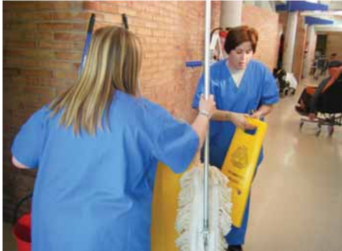
Treballant en equip