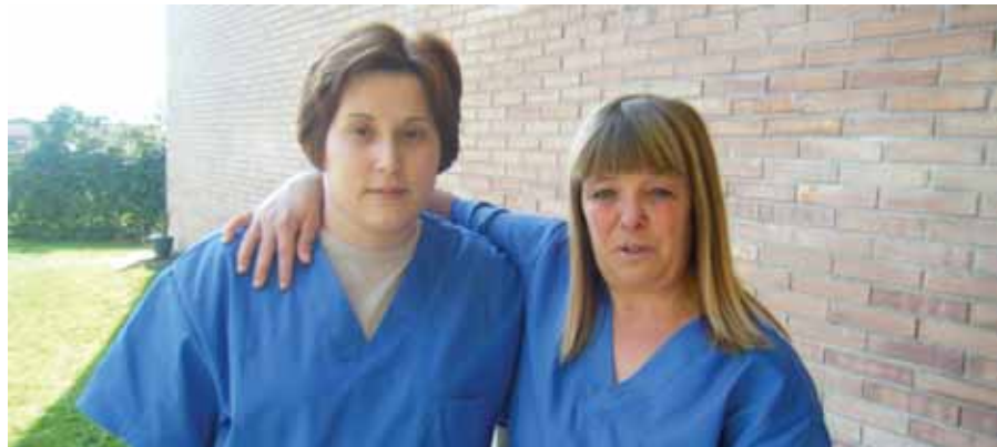
Estem organitzant entre tots un gran servei

Estem organitzant entre tots un gran servei, un servei que té futur... Ara ja sí que podem anunciar que el servei de neteja del CET s'enlaira.