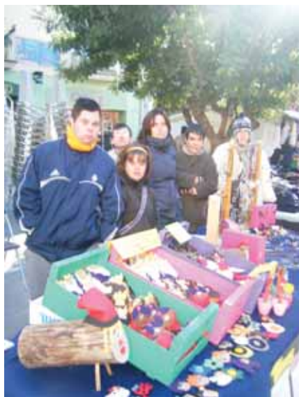
Molt abrigats a la parada