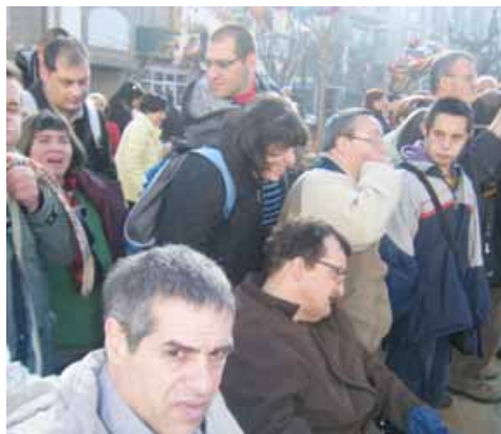
A punt per veure la desfilada

Un cop més agraïm a l'Ajuntament de Sant Feliu la bona acollida i estimació que mostra pel nostre col·lectiu.