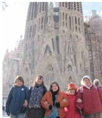
Al peu de la Sagrada Família