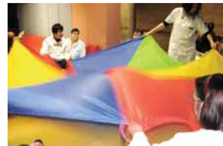
Activitat amb el paracajudes

Al mes de febrer s'han fet canvis en l'organització interna del centre: els monitors han canviat de grup i un petit nombre d'usuaris ha canviat de llar per millorar la seva atenció. Per a aquest any, també es programen noves activitats pedagògiques i s'amplia l'horari per portar-les a terme.