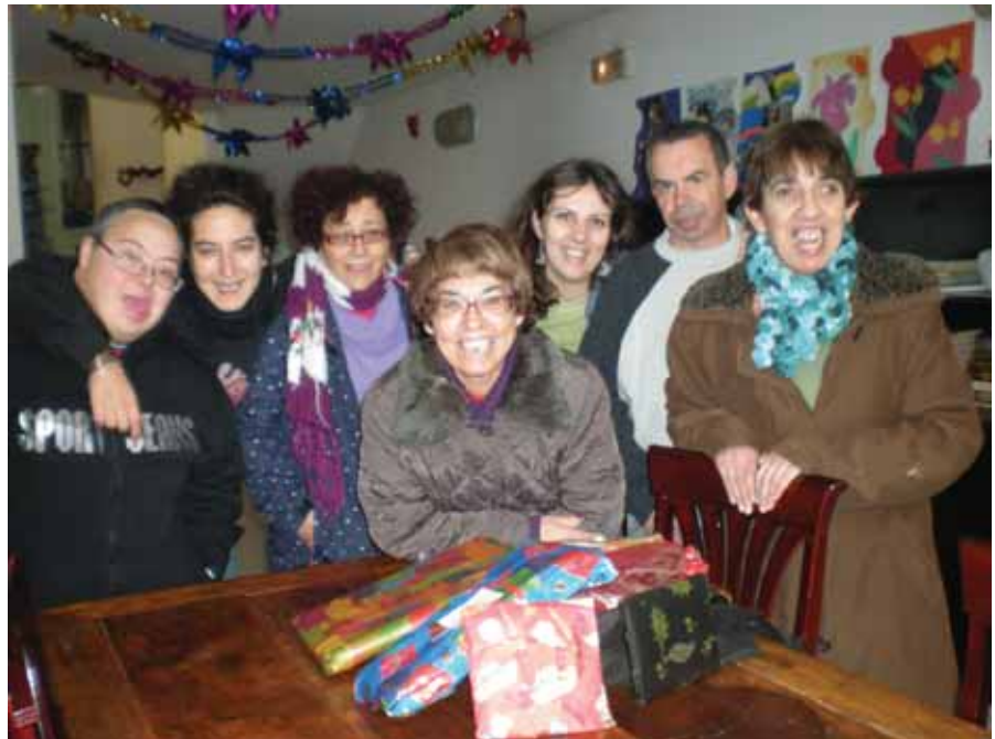
A punt per obrir els nostres regals