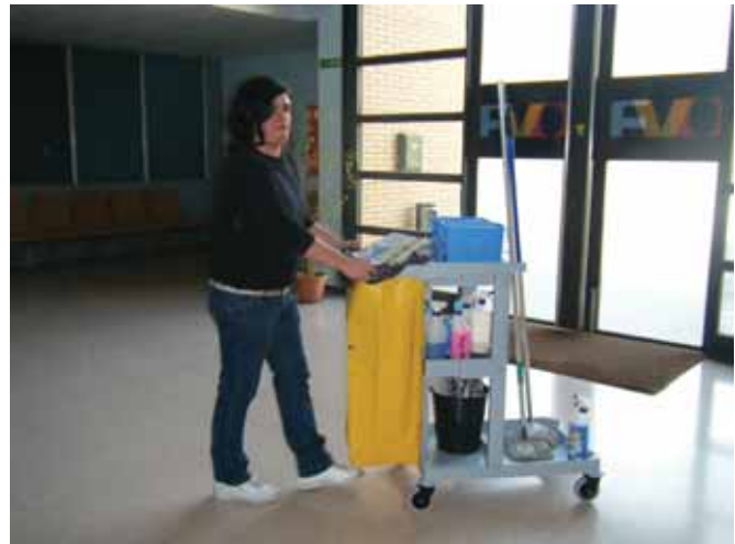
Treballant per assolir el repte de treballar per l'empresa ordinària

iniciatives... fins i tot els peons, que suplien la manca de feina amb la neteja de la nau. Val a dir que uns més que d'altres!