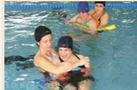
Activitat de piscina a la Roca del Vallès

Al mes de febrer s'ha iniciat l'activitat de piscina que es fa a les instal·lacions de la Roca del Vallès. Un total de 14 persones es beneficiaran de l'activitat.