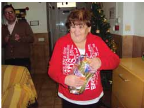
Obrint regals de reis

Hem passat unes noves festes de Nadal, amb regals, Reis, celebracions i un bon inici d'any