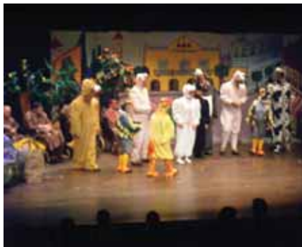
Un instant de l'obra "Titirimundi"

de l'autor Lluís Coquard, començant la seva preparació el mes de gener amb la distribució dels papers i començar els assaigs el mes de febrer. Amb la intenció de tenir temps suficient per a preparar i organitzar tot el que comporta un acte d'aquestes característiques, amb la previsió de representar-la al mes de novembre de 2011 en el marc de la celebració de l'acte institucional "El Dia de la Fundació".