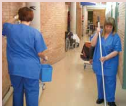
La Residència, el primer pas del nou Servei de Neteja de l'FVO

La Fundació Privada Vallès Oriental sempre s'ha caracteritzat per ser una entitat dinàmica i valenta, que vetlla per adequar el seus serveis a les necessitats de les persones amb discapacitat intel·lectual. El servei productiu de l'FVO, el Centre Especial de Treball "Xavier Quincoces", a banda d'atendre les necessitats específiques de la plantilla de persones amb discapacitat intel·lectual que hi treballa, també manté una preocupació constant per adaptar-se a les demandes del mercat i resoldre les necessitats dels seus clients.