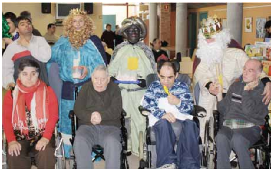
Els Reis Mags van visitar la Residència i ens van portar molts regals