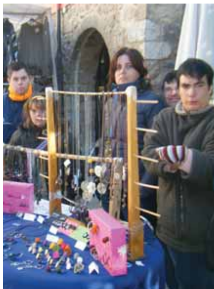
Tot a punt a la parada de l'FVO al mercat de Granollers