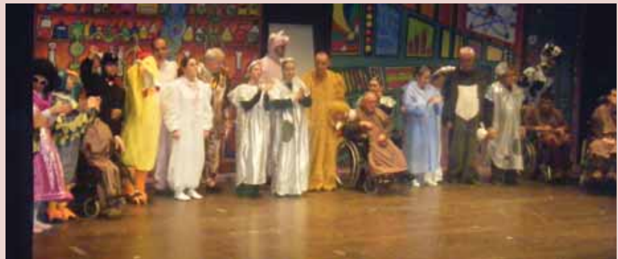
Aquest any també rebrem els aplaudiments del públic