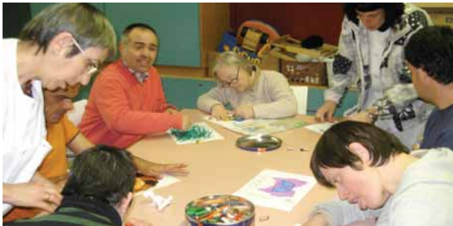
Preparant les màscares de Carnaval