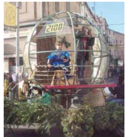
Un dels carruatges