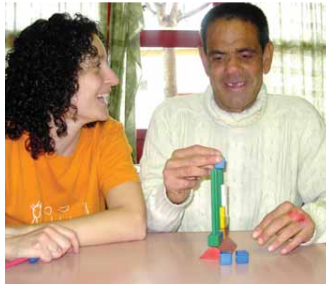
Operacions mentals bàsiques