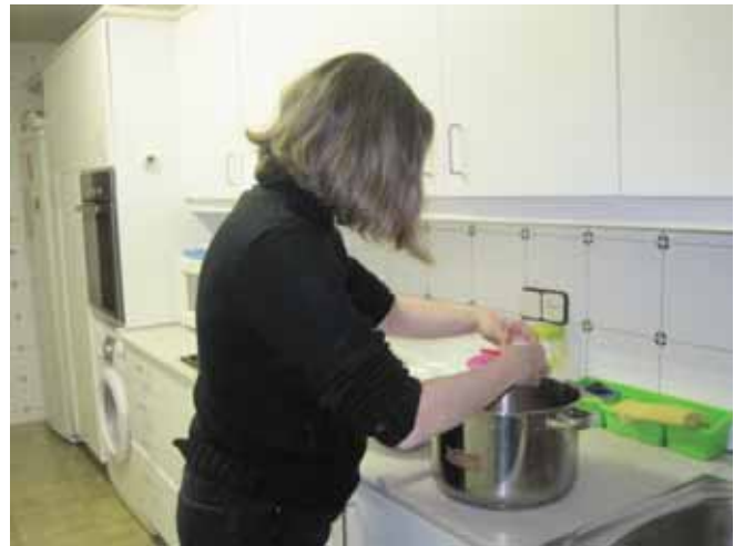
Fem més magdalenes