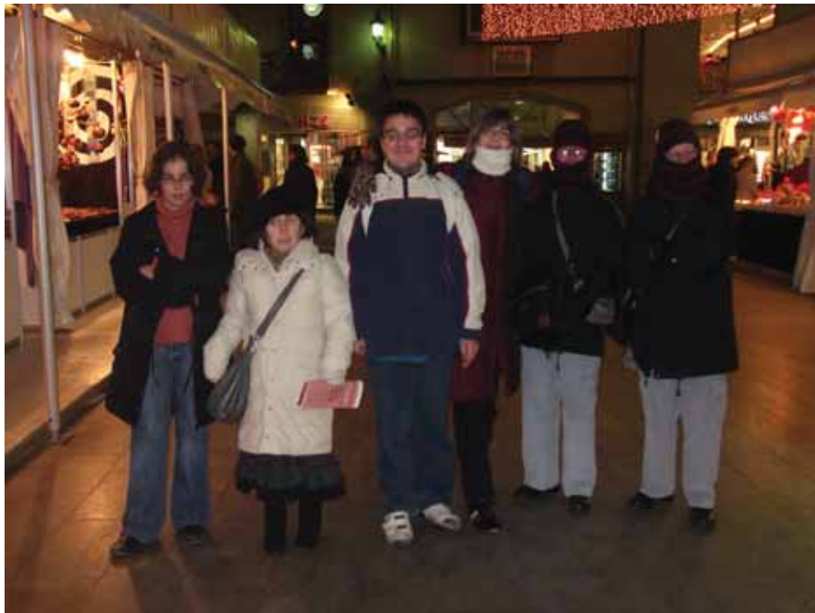
Passejant entre les botigues decorades per Nadal