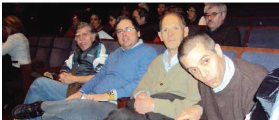
Anem al concert