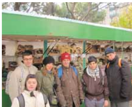
Tot i el fred, va ser una sortida molt entretinguda

res millor que una bona passejada pels carrerons del Born, fent una paradeta per escalfar-nos tot fent un cafetó. Tot amb ganes de gaudir de l'entorn i de la bona companyia.