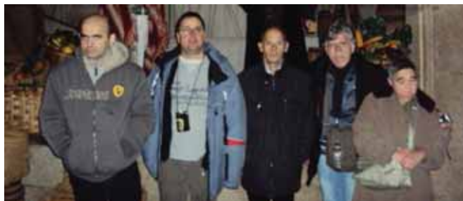
El Museu de la Cera