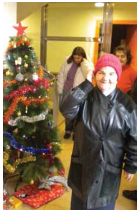
Les llars també estan decorades per l'ocasió