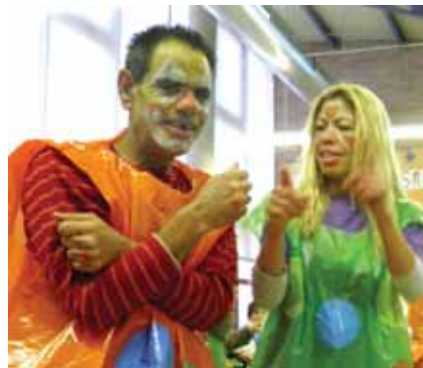
Aprenent un ball nou