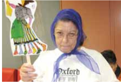
Escenificació de la vella quaresma

S'han fet tallers de manualitats al centre, per preparar les disfresses i les màscares de carnaval. Tots, en la mesura de les seves possibilitats, hi participen confeccionant la disfressa o pintant les màscares. També s'han fet tallers on es parla de la vella quaresma; una senyora molt vella i arrugada amb set cames que va perdent d'una en una cada setmana. Es fan petites representacions amb música sobre aquest tema.