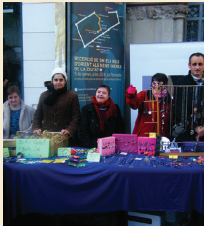
Tot a punt a la parada

Hem venut força i després ja ens hem quedat a dinar i hem aprofitat el dia. Tot i que estem cansats, ens ho hem passat molt bé i esperem tornar-hi aviat, això sí, hem de tornar a treballar de valent per a tenir més coses!!