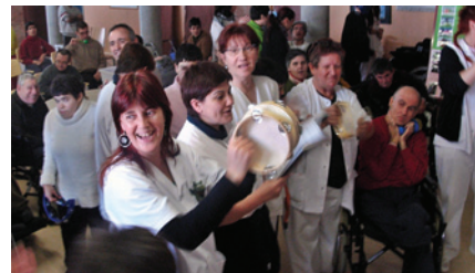
Cantada de nadales

El dia 6 de gener, com sempre, van venir els Tres Reis Mags d'Orient al centre. Van portar regals per tots de manera individualitzada, però també van haver alguns regals comuns com un gran televisor i un reproductor per veure pel·lícules, una càmera de vídeo i molts jocs educatius... Agraïm a totes les persones que han col·laborat per fer d'aquest dia un dia molt especial!