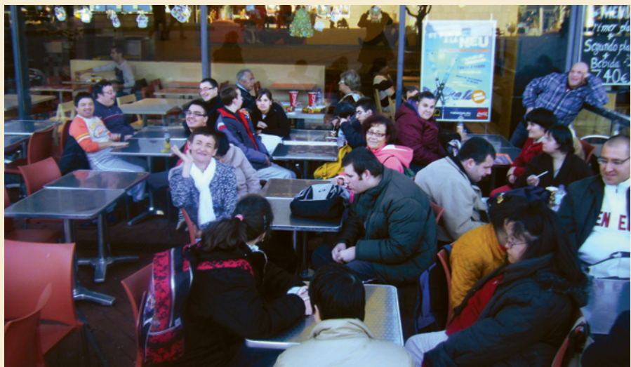
Un moment del partit

La veritat que en general va ser una sortida molt tranquil·la on vàrem poder aprofitar del bon temps i de la companyia de tots nosaltres.