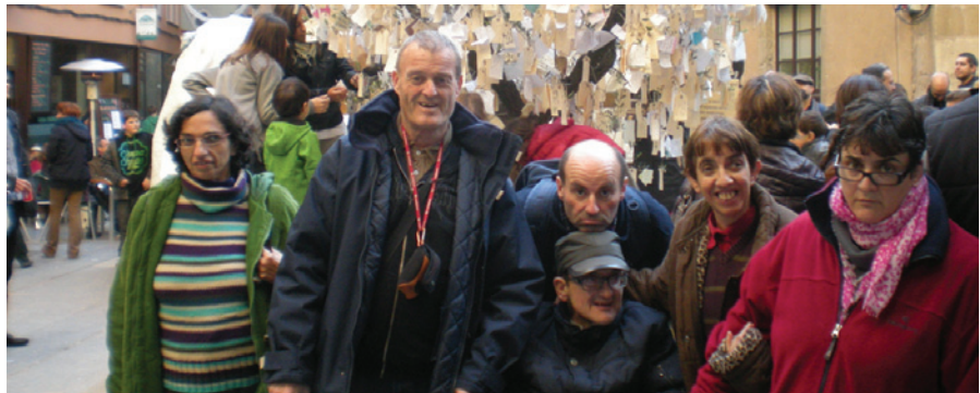
Mercat medieval de Vic