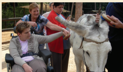
Acariciant al ruc

El 19 d'octubre des de la Residència i Centre de Dia "Valldoriolf" es va fer una excursió a Canyamars (Parc Natural del Corredor) per conèixer el Ruc català. Algunes famílies ens van acompanyar, com ja és habitual, a la sortida.