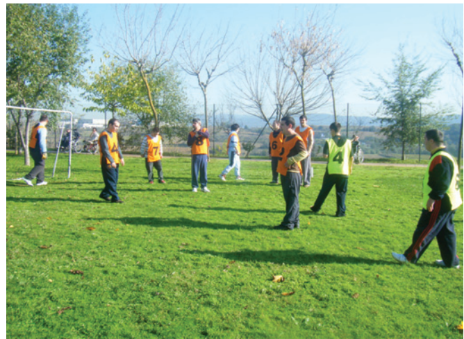
Un moment del partit