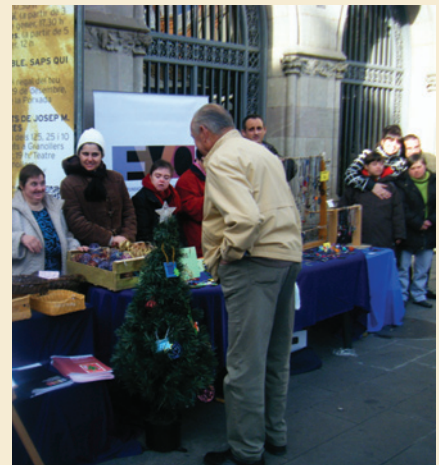
Hem venut un munt de peces!