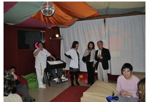
Explicuem com funciona la sala d'estimulació sensorial