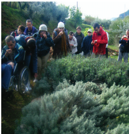
Gaudint de les diverses olors