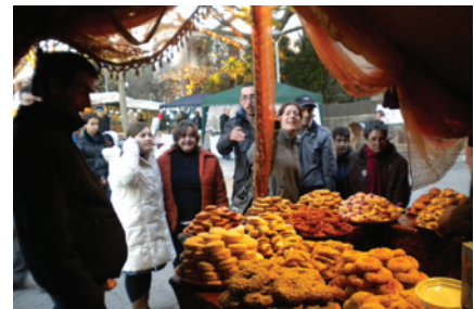
Fira de Nadal