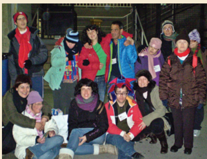
Preparats per veure el partit