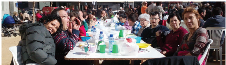
Tots a taula

El dimarts de Carnestoltes 4 grups de l'STO hem estat a Sant Feliu de Codines per celebrar l'Escudellada popular. Hem estat molt ben acollits i atesos per les persones que formen l' associació i hem gaudit molt de la festa. Aquesta vegada el temps ens ha acompanyat i hem fet un passeig fins al Parc Usart, emplaçament que està enmig de la natura. Amb ganes de repetir de nou!