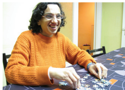
L'Adela fent alguna de les tasques de la llar que li corresponen

No sé, estoy bien en la llar y en el centro, con los compañeros, además de los del centro, ahora soy más amiga de los que están en el piso los fines de semana.