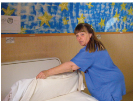
Donant servei a la residència

preparar i especialitzar als peons per aquesta nova via de negoci, però sobretot calia il·lusionar-los, fer-los participants d'aquest projecte que havia nascut per ells.