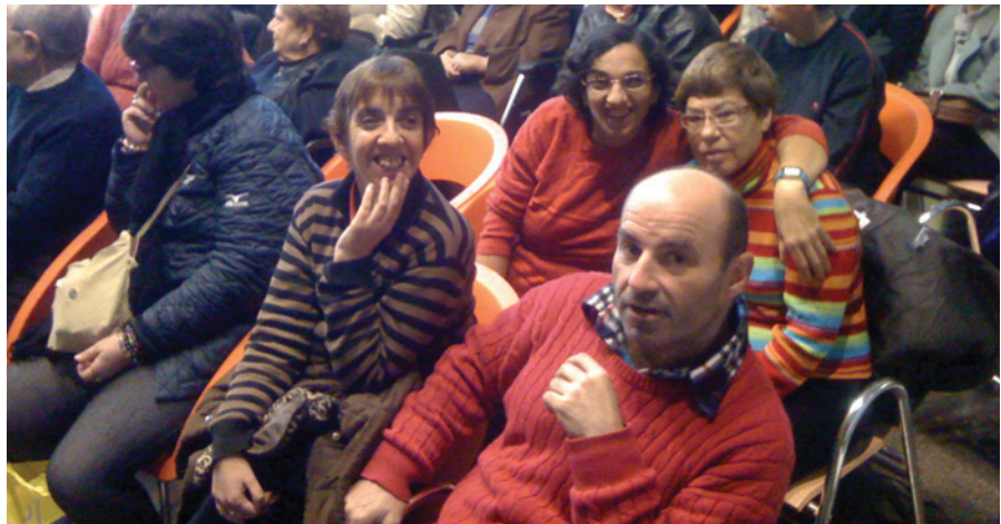
A la Festa de la Discapacitat