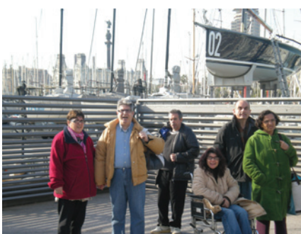
Port de Barcelona