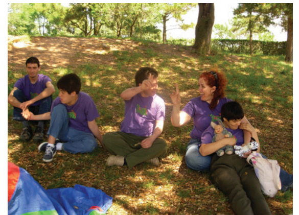
Reposant i preparats per dinar

Totes aquestes coses que tenim en compte diàriament ens han portat a una interrelació en la qual ells han après de nosaltres i nosaltres d'ells. Estem satisfetes de la tasca perquè pensem que