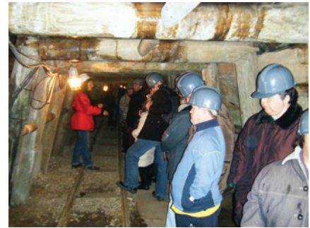
Fent-nos a la idea de com treballaven els miners

Després del circuit pel museu vam dinar a la zona de picnic, gaudint del bon dia i de l'entorn muntanyenc que ens envoltava.