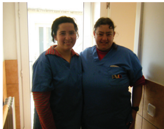
Part de l'equip del servei de neteja de les llars

Així, ens reunim setmanalment per tractar temes importants, relacionats amb la bona marxa del servei: el material més adient, si cal canviar la planificació d'una tasca, com dir les coses ... i un tema recurrent, i no per això menys sobtat, insistir que cal començar a treballar a l'hora, i no abans, que és el que acostuma a passar.