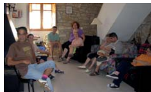
La casa rural de Talamanca

Vam caminar pels carrers del poble, i després vam baixar fent un passeig fins una font d'aigua, on vam veure aigua fresqueta.