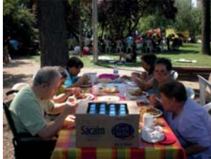
Festes de Granollers: l'arrosada