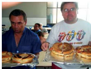
Unes rosques realment boníssimes!