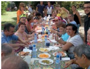
... i butifarrada