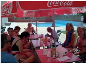
Cal refrescar-se a la piscina...