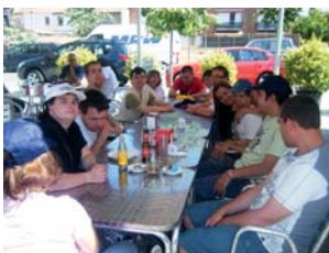
Un bon entrepà i una bona xerrada entre companys

Aquest estiu, diversos grups del Servei de Teràpia Ocupacional hem anat a passar el dia a les piscines municipals de La Roca del Vallès. Hem anat a les furgonetes de la Fundació i els usuaris/àries gaudeixen molt durant el trajecte. Un cop a les piscines ens podem fer passar la calor amb un bon bany, gaudint del sol a la gespa i compartint un dia de diversió amb els companys del centre.