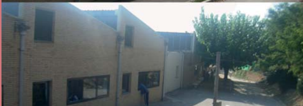
A dalt, la façana posterior del mateix centre, abans de començar les obres A baix, la façana exterior, un cop finalitzades