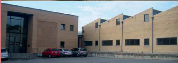
A dalt, la façana del Centre Ocupacional "Xavier Quincoces" abans de començar les obres A baix, imatge de la façana del Centre Ocupacional un cop finalitzades