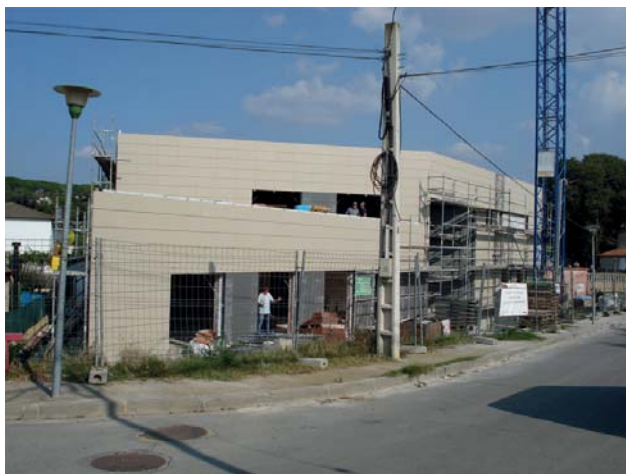
Visió general de la façana de l'edifici

*A mitjats del mes de novembre, s'iniciarà el programa de visites d'obres de les famílies dels usuaris en llista d'espera. El Dept. de Treball Social de l'EVO serà l'encarregat d'organitzar-les.