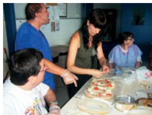
Preparant les rosques farcides