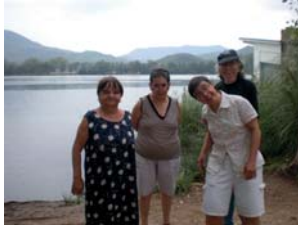
Excursió al llac de Banyoles

Durant les vacances tots tenim més temps lliure i a les llars s'incrementen les activitats i les sortides. Aquest estiu hem fet excursions per visitar algunes poblacions, Mataró, Tossa, Santa Susanna, Calella, Banyoles, Montesquiu, Castellterçol, Arenys, Sant Pol de Mar i diferents indrets de Barcelona (Port, Tibidabo, Horta, Gràcia), per descomptat hem anat a banyar-nos sovint, a la platja o a la piscina, també hem sortit a menjar fora, hem pogut jugar a bitlles, anar al cinema, a la discoteca i participar en les festes de Gràcia, de Cardedeu i sobretot de Granollers.