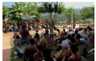
Festa d'estiu 2009

Com ja és habitual professionals i residents lluïem la tradicional samarreta que enguany es va decorar amb un dibuix de la Carme Segalés.