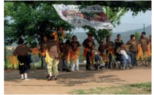
Festa d'estiu 2009

pintat els usuaris i a fora d'un mural i pancartes molt estiuenques.