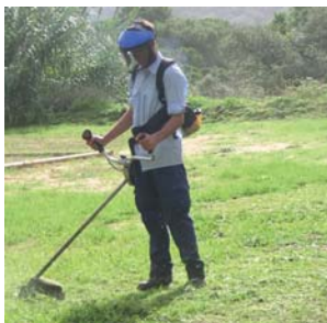
El manteniment i neteja de zones enjardinades del servei de jardineria de l'FVO

La Junta de Govern Local de l'Ajuntament de Montornès del Vallès, en data 10 de setembre de 2009, ha adjudicat el contracte del servei de manteniment de les zones verdes municipals a la Fundació Privada Vallès Oriental després que l'FVO guanyés el concurs obert iniciat pel consistori. Aquest contracte permet la integració sociolaboral de 6 persones amb discapacitat intel·lectual dins del servei de jardineria del Centre Especial de Treball "Xavier Quincoces" de la Fundació.