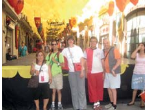
Festes de Gràcia