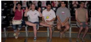
Esperant per veure l'espectacle del circ!

El passat dijous 23 de juliol un grup de la Residència i Centre de Dia "Valldoriolf" va marxar ben d'hora direcció Sant Esteve de Palautordera on es troba ubicat el Circ Cric. En aquesta ocasió no anaven a veure només un espectacle sinó a participar del casal d'estiu.