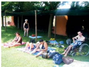
Fent passar la calor a la piscina de La Roca

Aquest estiu, diversos grups del Servei de Teràpia Ocupacional hem anat a passar el dia a les piscines municipals de La Roca del Vallès. Hem anat a les furgonetes de la Fundació i els usuaris/àries gaudeixen molt durant el trajecte. Un cop a les piscines ens podem fer passar la calor amb un bon bany, gaudint del sol a la gespa i compartint un dia de diversió amb els companys del centre.