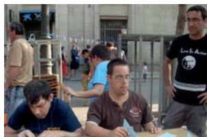
Participant del taller de papiroflèxia