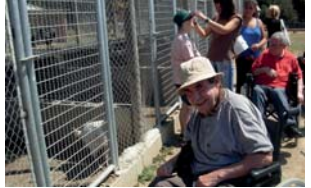
Veient els animals

Després de fer les diferents activitats van anar fins al menjador on tots junts van dinar per a agafar forces perquè els més valents van anar a fer un vol pel bosc. Tot just van arribar del passeig ja era hora de tornar cap al centre. Va ser un dia molt maco i amb ganes de repetir l'experiència a la tardor.