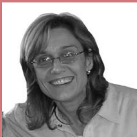
Pedagoga del Centre Ocupacional "Xavier Quincoces" des de l'any 1992-2009.