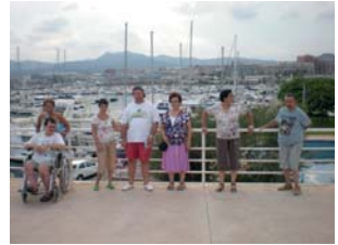
Visita al port de Mataró