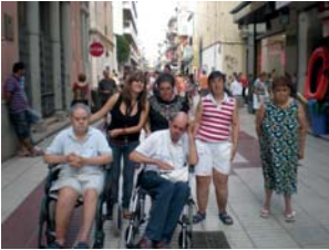
Passejant per Calella