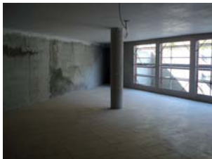
Vista de la sala de psicomotricitat a la planta baixa

S'HAN ACABAT LES VACANCES I LES OBRES DE LA LLAR-RESIDÈNCIA “JAUME ANFRUNS I JANER” DE SANTA EULÀLIA DE RONÇANA HAN TORNAT A AGAFAR EL RITME QUE ENS AGRADA.