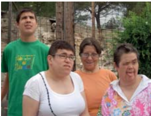
Quines aus més maques!

El divendres 17 de juliol al matí van anar fins a Sant Feliu de Codines per a visitar el Cim d'Àligues, en allà ens van fer una visita guiada per totes les aus que allà viuen, van explicar força curiositats i tots prestaven força atenció.