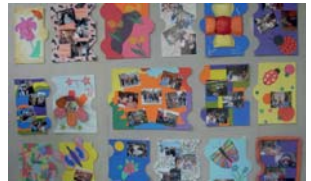
Puzzle confeccionat amb les imatges de les llars

La decoració ha estat preparada durant dies a les mateixes llars i tothom ha quedat molt sorprès de la imaginació i el treball realitzat. Feia goig! Molta música, ball, un bo i abundant berenar-sopar i el més important salutacions, coneixences, relacions, conversa... veient com s'ha desenvolupat, com hem acabat tots de cansats però contents, i les opinions dels assistents, es pot considerar que ha anat molt bé.