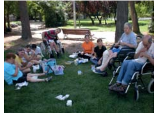
o fer un pic-nic a l'aire lliure