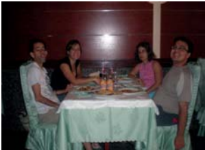
Anar al restaurant, pot ser una bona alternativa...