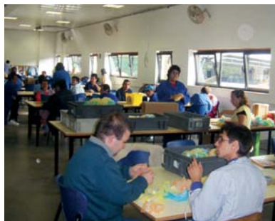
Una de les aules on destaca la gran il·luminositat actual

Malgrat que el projecte reunia totes les condicions definides a la convocatòria i la Fundació es comprometia a finalitzar les obres a data 31 de desembre d'enguany, demostrant el compromís de rapidesa en l'execució de les obres mostrat per la Junta del Patronat de la Fundació.