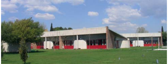
La Residència i Centre de Dia "Valldoríolf" va iniciar el seu servei el 1994, ara fa quinze anys

Acte festiu de germanor amb altres residències i els usuaris i usuàries de la resta de serveis de l'FVO, també comptarem amb l'espectacle "La lluna, la pruna" d'ombres xineses de tots colors a càrrec del grup Cia. Mercè Framis. Teatre d'Ombres.