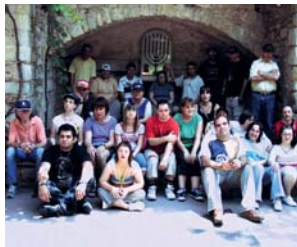
Res millor que una bona passejada pel Call Jueu

Tot i que la pluja ha fet acte de presència a mig passeig, ni molt menys ens ha esgarrat les ganes de gaudir de l'entorn i de la bona companyia.