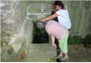
La font de Talamanca