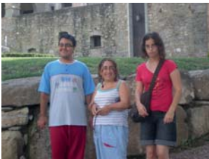
Castell de Montesquiu