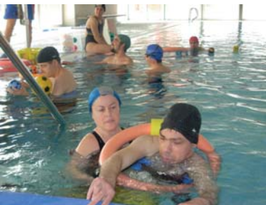
Activitats de piscina

L'activitat de piscina ha estat i és una activitat que permet que molts dels nostres usuaris experimentin situacions o moviments del seu cos que al seu dia a dia no poden fer.