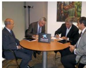
Moment de la firma d'aquest acord de col·laboració

A banda, la col·laboració també es centrarà en l'adequació i millora de l'equipament d'una sala d'estimulació sensorial ja existent, adreçada a l'atenció i rehabilitació de persones amb greus discapacitats a la Residència i Centre de Dia "Valldoriolf". Amb aquest nou material es podrà proporcionar un ventall més ampli d'estímuls que s'adapti a les necessitats de cada un dels usuaris plurideficients amb necessitats especials i persones amb dificultats relacionals i/o trastorns de conducta.