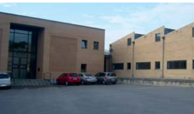
La nova façana del Centre Ocupacional

Al llarg dels mesos de juliol, agost i setembre, les obres de la III Reforma del Centre Ocupacional han estat funcionant a plena màquina. Un gran esforç per tal que els usuaris i usuàries del Centre poguessin iniciar el nou curs amb major confort i il·luminositat, tot això amb les màximes garanties de protecció del medi ambient i aplicació de criteris de sostenibilitat en la reforma.