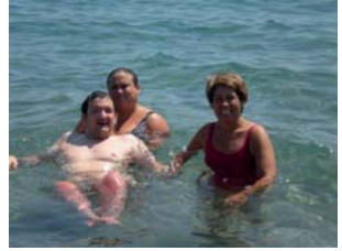
I a la platja