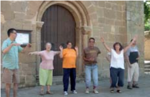
A la porta de l'Església