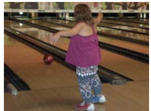
Partida de bitlles