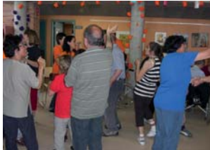
La música i el ball han estat força animats

Es tenia previst fer-la al jardí de la Residència i Centre de Dia "Valldorioll" però, casualment, ha estat un dels pocs dies que ha plogut i l'hem traslladat a l'interior.