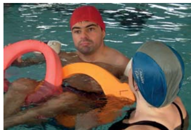
Fent exercici dins l'aigua