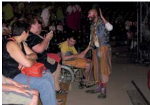
Quin riure amb els pallassos...

Un cop van arribar ja els estaven esperant per a donar-los la benvinguda, i seguidament es van posar a esmorzar. Després ja van començar les activitats amb un espectacle d'animació, més tard veure van ensenyar diferents tècniques de circ i per últim van fer un petit espectacle de circ amb Tortell Portrona. Van passar un dia magnífic aprofitant fins a l'últim moment!