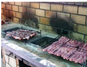
Quin dinar que ens esperat

Allà vam coure les botifarres a les graelles i vam dinar a l'aire lliure. El temps ens va acompanyar i els usuaris van gaudir molt dels espais.