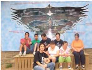
Visita al Cim d'Àligues

Un cop finalitzada la visita van fer una demostració de vol, era impressionant veure tantes aus volant per damunt dels caps i aus de dimensions impressionants i el més bo de tot que tornaven al lloc d'on havien sortit. Després van anar a la zona de picnic per tal d'agafar forces i tornar cap al centre.