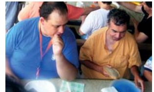
Un pícnic en companyia dels amics del Centre Ocupacional

del Montnegre. És una sortida de tot el dia, tradicional de cada estiu al Centre Ocupacional, on els nostres usuaris/àries amb els seus educadors poden gaudir d'un dia a l'aire lliure, en contacte amb la natura i gaudir alhora d'un bon àpat consistent en dinar a la brasa... Que més es pot demanar que un dia de pícnic en companyia dels amics del centre?