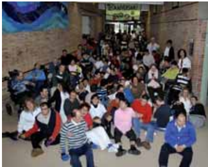
Foto de família del 18è aniversari

Un any més, la Residència celebra el seu aniversari! Del 26 de novembre al 28 de novembre s'ha celebrat el 18è aniversari de la Residència i Centre de Dia "Valldoríolf". La festa es va celebrar el dilluns 26 de novembre. Com sempre, es va fer