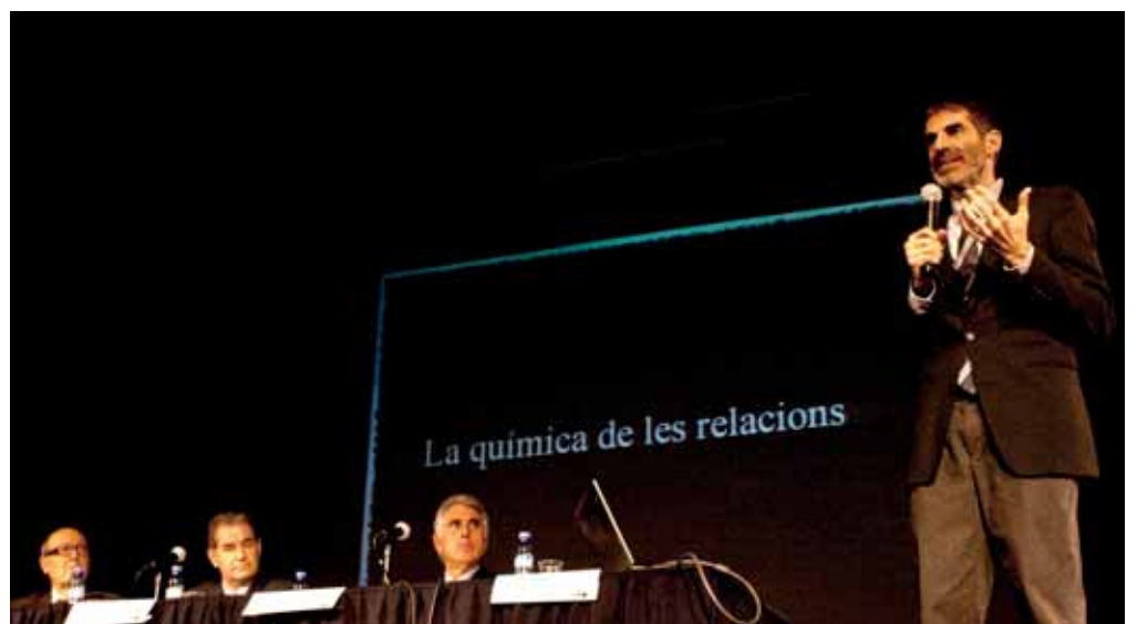
"La Química de les Relacions" conferència del comunicador Ferran Ramon-Cortés per a l'FVO