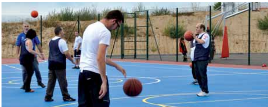
Per acabar la setmana de l'esport, bàsquet