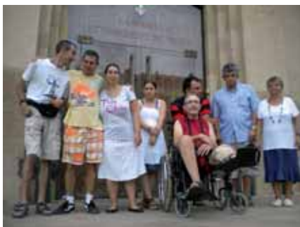
A Les Franqueses

Al Servei d'habitatge hem sortit molt a l'estiu i també hem adaptat les activitats i sortides a la tardor... fins arribar a la celebració de Tots Sants amb l'entrada de l'hivern.