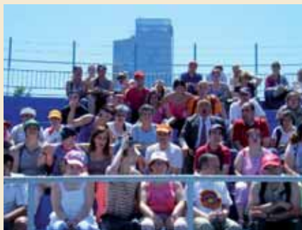
Els dofins les estrelles de la visita

Aquest any, per fer una bona entrada a l'estiu, els grups de STO hem anat al Parc del Zoo de Barcelona.