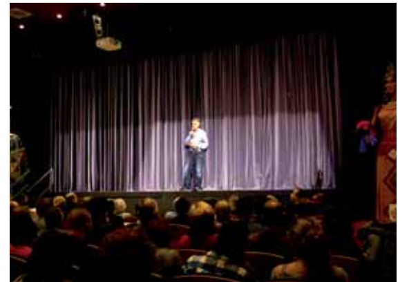
La benvinguda a l'estrena teatral

Ens queda molt treball encara per fer, però amb aquest equip humà les famílies han d'estar tranquil·les: els seus familiars estan en molt bones mans. Al Patronat ens queda posar en marxa nous projectes que són imprescindibles per a millorar la qualitat dels nostres serveis. I com ja vaig expressar en l'acte oficial del 20è aniversari, sense vosaltres no seria possible. Gràcies.. I què dir dels "artistes", heu demostrat del què sou capaços de fer amb el vostre esforç, sou l'ànima de la Fundació. Ens demostreu cada dia que val la pena el que fem i en volem més, molt més. Ens esforçarem per innovar nous mètodes de treball per tal que la societat entengui que sou persones amb unes altres capacitats, diferents a les nostres; però iguals, no sou diferents.