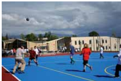
Els equips en plena disputa de la pilota