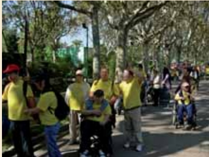
Veient els animals

El dimecres 3 d'octubre es va fer a la residència una sortida al Zoològic de Barcelona. Van participar trenta-cinc usuaris, i alguns d'ells anaven acompanyats dels seus familiars, ja que es va convidar a les famílies a participar-hi.