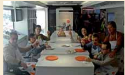
Degustant els resultats del taller

Els dies 8 i 9 de novembre, dos grups d'usuaris van participar d'una activitat que ofería la Fundació Alícia sobre alimentació. El bus Alícia, la unitat mòbil de la Fundació Alícia (Alimentació i Ciència) de la Fundació de Catalunya Caixa, va oferir dos tallers a usuaris de la Residència i Centre de Dia amb l'objectiu de fer difusió dels bons hàbits alimentaris.