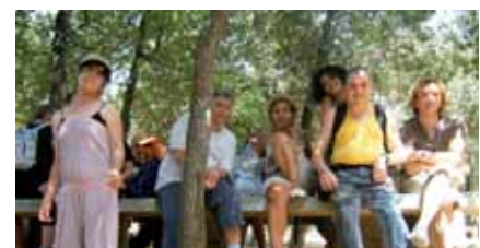
Gaudint del camp

El dia 28 de juny, cinc grups de l'STO vàrem anar a gaudir del camp al "merendero" de Can Miret a Llinars. Vàrem gaudir molt veient els animals de granja i també vàrem menjar una barbacoa amb botifarres a la brasa. Va fer molt bon dia i vàrem poder gaudir molt del dia al camp.