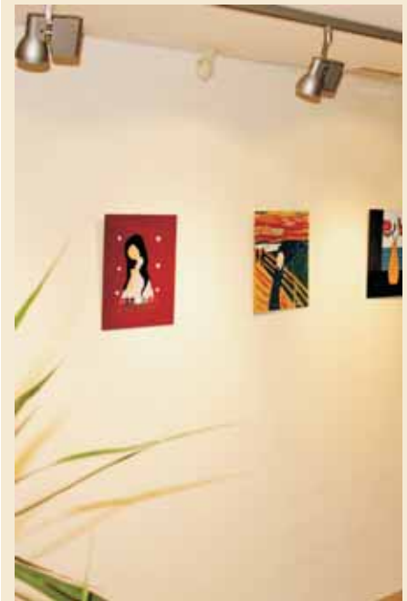
Una vista general de l'exposició al Centre Cultural de La Roca

Del dilluns 19 i fins al divendres 30 de novembre s'ha realitzat l'exposició "Els artistes de l'FVO" al Centre Cultural de La Roca del Vallès. Es tracta de la segona exposició d'obres i enguany està dedicada a la celebració dels 20 anys de la Fundació. Les creacions artístiques estan realitzades per persones amb discapacitat intel·lectual ateses al Centre Ocupacional "Xavier Quincoces" i a la Residència i Centre de Dia "Valldoriolf".