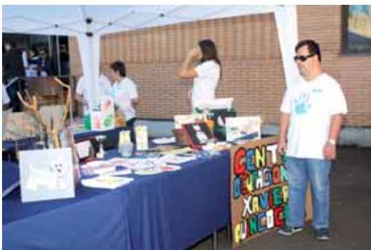
Les parades a punt per a les famílies

La Fundació Privada Vallès Oriental (FVO) va reunir, el diumenge 30 de setembre, a més de 300 persones entre professionals, persones amb discapacitat intel·lectual ateses als centres i serveis de l'entitat, les seves famílies i amics en general de l'FVO per celebrar la "Festa de Famílies de l'FVO", una trobada festiva i per a compartir activitats esportives i de lleure. Una festa que es va emmarcar dins dels actes que la Fundació ha organitzat per a celebrar els seus 20 anys.