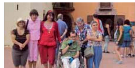
Passejant al Montseny