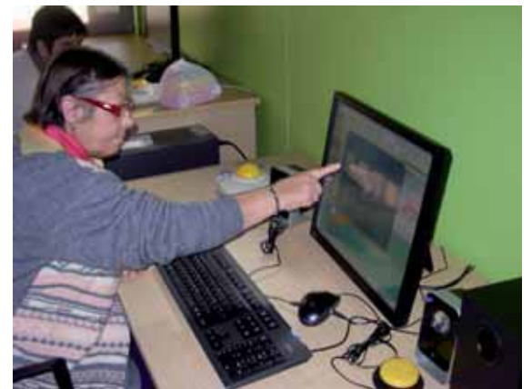
Estrenant la nova pantalla tàctil

En definitiva donarem no només l'oportunitat d'augmentar el nivell de comunicació sinó també l'apropament a la informació de la societat, gràcies als mitjans informàtics i tecnològics i així habilitar-los per tal d'aconseguir la normalització i en definitiva millorar la seva qualitat de vida. Podran estar informats del què passa al seu voltant i treballar d'una manera més educativa els continguts.