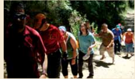
En plena passejada per RACC

Després vam dinar a la zona de picnic fins que va arribar l'hora de marxar. En definitiva, vam passar un bon dia tot plegats per acomiadar-nos abans de les vacances!