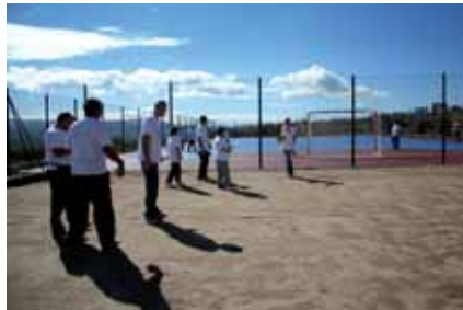
Una de les moltes partides de petanca