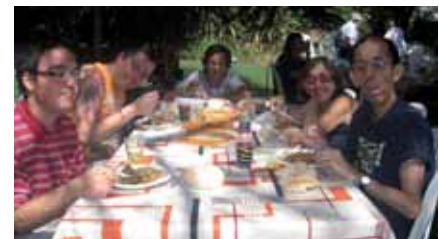
Arrossada de Festa Major de Granollers