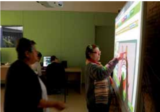
La pissarra digital ens permet fer un munt de noves activitats

Una de les aules actuals s'ha adaptat per tal d'aconseguir una sala on poder treballar la comunicació i l'accés a la informació de les persones ateses a la Fundació per mitjà de les noves tecnologies. Comptem amb mobiliari especial fet a mida i on aquells usuaris que es desplacen en cadira de rodes, poden treballar a l'alçada adequada. Hi ha quatre ordinadors totalment equipats amb adaptadors i commutadors segons les necessitats de cada persona que realitzi l'activitat, i seguint tots ells, un mateix ordre per tal de facilitar l'aprenentatge. També com a eina totalment innovadora disposem d'una pissarra tàctil, de 88" polzades que facilita poder treballar en grup captant l'atenció i motivant-los d'una manera més dinàmica, divertida i visual. I per descomptat, tots els ordinadors disposen de la connexió a Internet per així obtenir els recursos que a l'actualitat estan disponibles dintre de la xarxa.