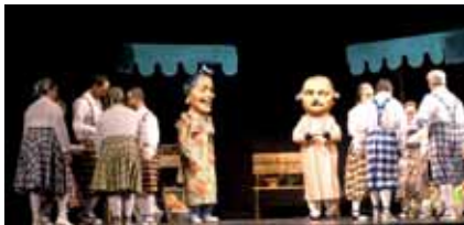
Els ballarins i ballarines a punt

L'obra està interpretada per un grup de 21 actors i actrius, persones ateses als diferents serveis de la Fundació i on també hi participen com actors o actrius diferents professionals l'FVO i està dirigida per Aníbal Carrasco, educador del Centre Ocupacional "Xavier Quincoces" amb el suport de la Comissió de teatre, que s'encarrega de dur a terme les diferents tasques que fan possible la