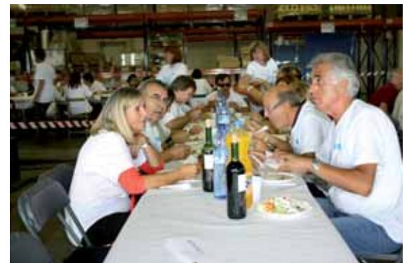
La taula del Patronat a punt per a la paella de germanor

d'Habitatge i es va celebrar una gran rifa amb artesanía feta als diferents centres de l'FVO.