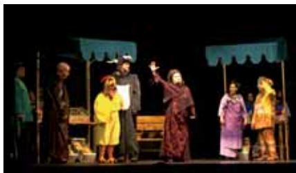
Un moment de l'obra "El testament d'en Nasi"